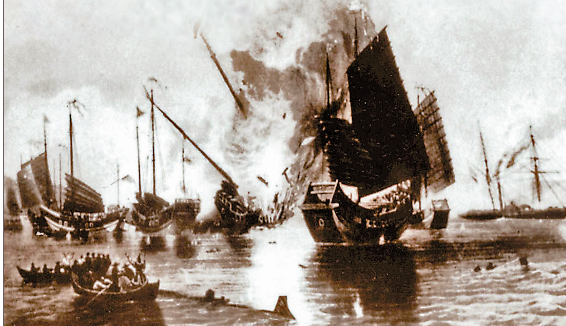
◆1840年，英國發動鴉片戰爭，幾艘英國炮艦闖入香港海灣。

儘管後來依然經歷過不少戰敗與挫折，但仍然不斷地做著一個又一個的改革家，以致中華民族最後能夠取得勝利，保留下來一個完整的中國，「這反映了中華民族始終自強不息的精神，這一點在現今依然需要學習和堅持。」