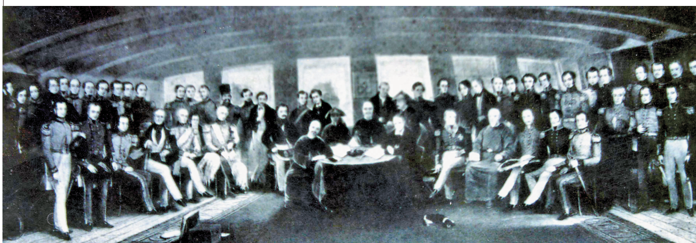
◆1842年8月29日，滿清政府和英國簽署了第一條不平等條約《南京條約》。資料圖片