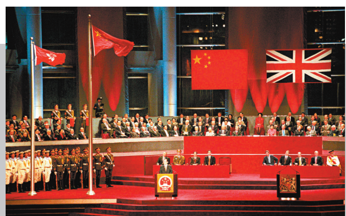
◆經歷150多年英國殖民統治，香港最終在1997年7月1日回歸祖國懷抱。資料圖片

「很有進步」，也就是這種史觀和史書，讓時下一些年輕人覺得國家仍是「十分落後和老套」，但是自己又從未親身到內地觀察和體驗過，也沒有與內地年輕人互相交流，「是十分糟糕的情況。」