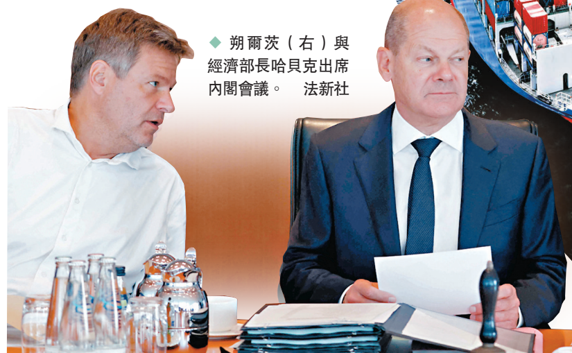
◆朔爾茨（右）與經濟部長哈貝克出席內閣會議。

德國總理朔爾茨上台後，德國聯邦政府加快「降低對華依賴」的進程，近日有德媒稱，德國經濟部和外交部欲否決中遠海運收購德國第一大港漢堡港 Tollerort 集裝箱碼頭 35% 股份。據路透社 14 日報道，德國政府內部就此問題存在分歧，德國企業界對當局擬否決收購計劃感到沮喪，漢堡港務集團高管警告稱，「拒絕中國人，對港口乃至整個德國來說都將是一場災難。」