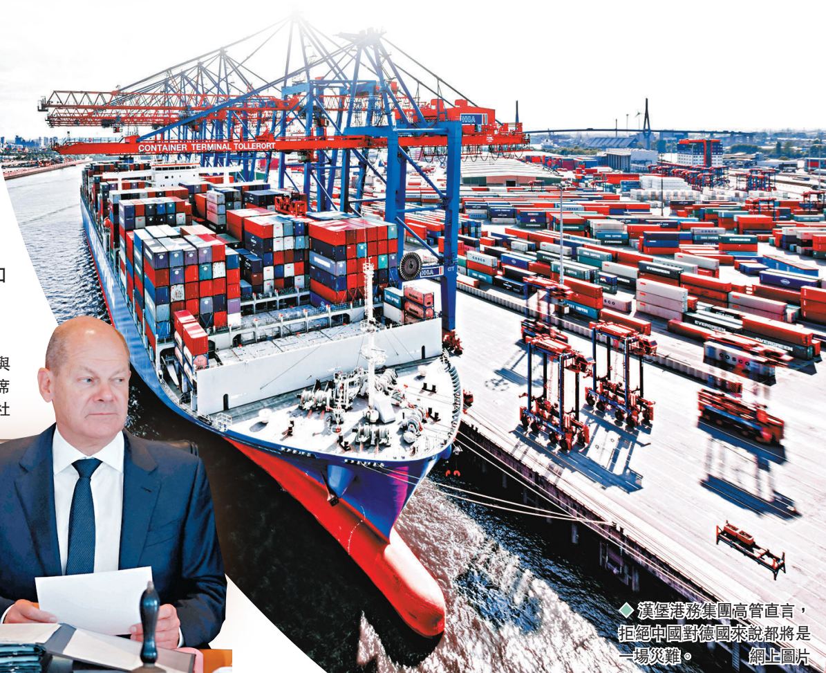
◆漢堡港務集團高管直言，拒絕中國對德國來說都將是一場災難。

中國外交部發言人毛寧 13 日回應稱，德國是貿易大國，深度參與經濟全球化和國際分工，有責任義務維護全球產業供應鏈的穩定。希望德方能恪守開放市場公平競爭的原則，客觀理性地看待中國投資，為中國企業提供公平、開放、非歧視的市場環境，不要將正常的經貿合作政治化，更不要以國家安全為由搞保護主義。