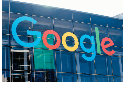
◆ 韓國要求企業在搜集用戶於其他公司使用的資訊時，明確告知用戶。 網上圖片

罰 43.4 億歐元。 Google 提出上訴，歐洲普通法院 14 日判 Google 敗訴，僅將罰款略減 5%。 法院表示同意歐委會裁決，認定 Google 為了有利自家搜尋引擎，而對 Android 流動裝置生產商施加違法限制。 不過基於技術因素，法院重新檢查 Google 違法行為時間後，裁定將罰款減至 41.25 億歐元。Google 仍可向歐盟最高級別法院歐洲法院提出上訴。 ◆綜合報道