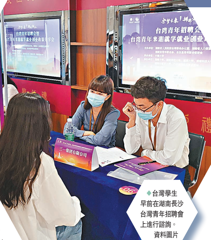
◆台灣學生早前在湖南長沙台灣青年招聘會上進行諮詢。資料圖片

香港文匯報訊 (記者 朱輝 北京報道) 針對台陸委會主委邱太三日前言論，國台辦發言人朱鳳蓮14日指出，邱太三的有關言論極力掩飾民進黨當局「倚美謀獨」「抗中保台」導致台海形勢緊張的事實，擺出緩和的姿態來「甩鍋」大陸、欺騙世人，卻難以掩蓋民進黨當局頑固謀「獨」的政治本性。她強調，「一國兩制」是為解決兩岸社會制度和意識形態不同而提出來的最具包容性的方案，是和平的方案、民主的方案、善意的方案、共贏的方案。在台灣的具體實現形式會充分考慮台灣現實情況，會充分吸收兩岸各界意見和建議，會充分照顧到台灣同胞利益和感情。 台陸委會主委邱太三日前稱兩岸關係本身是所謂「和平對等、主權民主不容侵犯」，政治分歧應以和平方式化解，並聲稱「不接受任何『解決台灣』的所謂政治方略或制度安排」，還以緩減當前台海形勢為由提出四點意見。 朱鳳蓮在14日發布會上也給出了「四點強調」以作回應。她指出，首先，世界上只有一個中國，台灣是中國的一部分，從來就不是一個國家。台灣問題本質是中國內政，兩岸關係的本質是大陸和台灣同屬一個