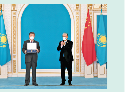
◆習近平在努爾蘇丹總統府接受哈薩克斯坦總統托卡耶夫授予「金鷹」勳章。

習近平致辭。習近平指出，托卡耶夫總統向我授予「金鷹」勳章，體現了哈方對中哈關係的高度重視，以及哈薩克斯坦人民對中國人民的深厚情誼。建交30年來，中哈關係始終保持高水平運行。雙方政治互信不斷鞏固，各領域合作蓬勃開展，高質量共建「一帶一路」成果豐碩，在國際事務中密切協作，為雙方發展振興提供有力支撐，為地區和平穩定注入強勁動力。展望未來，兩國世代友好、互利共贏、邁向繁榮的前景十分