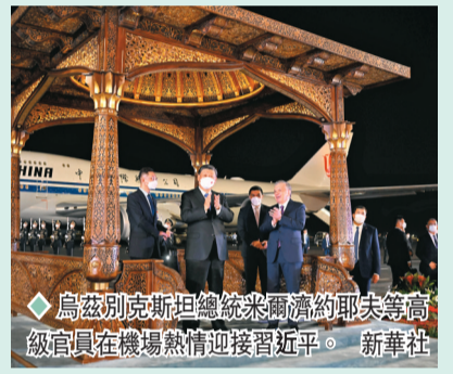
◆烏茲別克斯坦總統米爾濟約耶夫等高級官員在機場熱情迎接習近平。

當地時間9月14日下午，中國國家主席習近平乘專機抵達撒馬爾罕，開始對哈薩克斯坦共和國進行國事訪問。