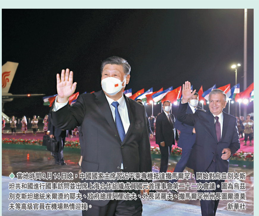
◆當地時間9月14日晚，中國國家主席習近平乘專機抵達撒馬爾罕，開始對烏茲別克斯坦共和國進行國事訪問並出席上海合作組織成員國元首理事會第二十二次會議。圖為烏茲別克斯坦總統米爾濟約耶夫、政府總理阿里波夫、外長諾羅夫、撒馬爾罕州州長圖爾濟莫夫等高級官員在機場熱情迎接。