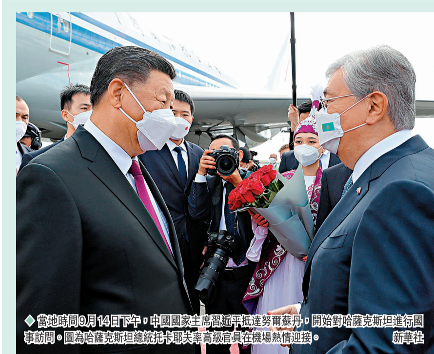
◆當地時間9月14日下午，中國國家主席習近平抵達哈薩克斯坦，開始對哈薩克斯坦進行國事訪問。圖為哈薩克斯坦總統托卡耶夫率高級官員在機場熱情迎接。