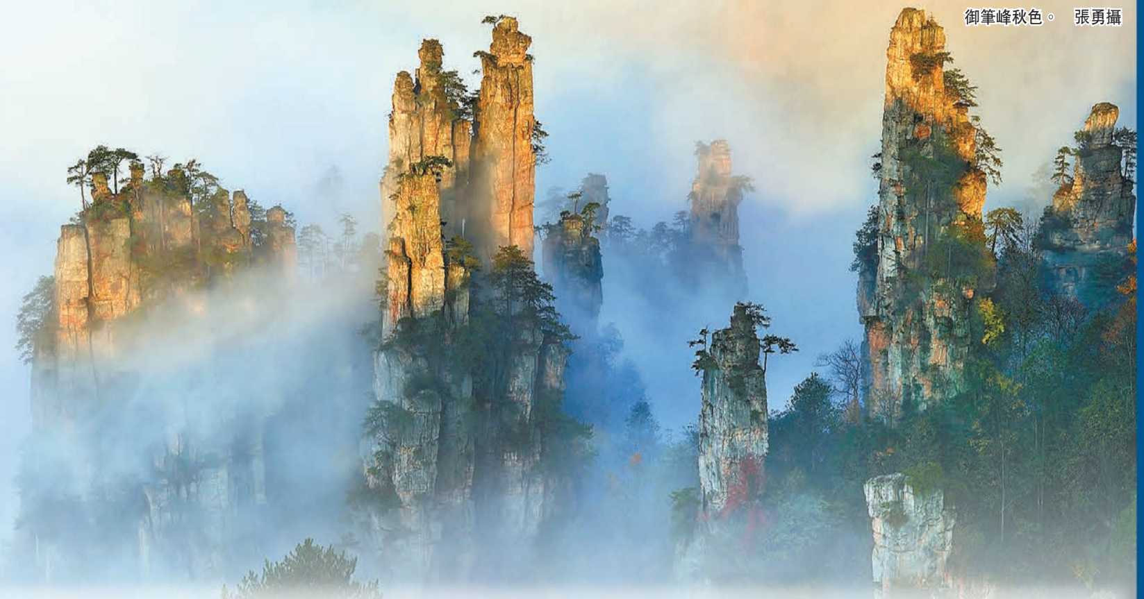
御筆峰秋色。

首屆湖南旅發大會舉辦前夕，《關於加快建設世界旅遊目的地的意見》（以下簡稱《意見》）的出台既體現湖南通過加快旅遊產業升級促進經濟社會高質量發展的決心，又彰顯湖南不斷擴大對外開放、打造具有全球吸引力旅遊產品體系的雄心，也為湖南省、市旅發大會的舉辦提供了基本遵循。 舉辦首屆湖南旅發大會是《意見》的題中應有之義。國家部委領導、國際旅遊組織負責人，境內外知名投資商、旅行商、旅遊業頭部企業，跨國企業駐中國代表，新聞媒體等嘉賓將參會。大會必將成為展示湖南近年來旅遊業高質量發展成就的重要窗口，成為湖南打造內陸地區改革開放高地的重要平台。 讓世界看見湖南，讓湖南走向世界！