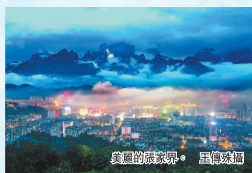
美麗的張家界。

柱」就是張家界山峯中的代表。這座山垂直高差達150米，彷彿刀削斧劈般屹立于天地之間。風靡全球的科幻電影《阿凡達》曾在此取景，這座山因此有了一個頗有國際性的名字——哈利路亞山。 張家界山中的另一代表是天門山，因自然奇觀天門洞而得名。天門洞懸掛在天門山海拔1300米的峭壁之上，洞外雲天相接處偶見霞光穿洞而出，猶如吉祥降臨人間。「天門山的美，對任何人都非常有吸引力。」在2022駐華外交官「發現湖南之旅」活動中，泰國駐華大使館大使阿塔育·習薩目這樣說。 而說到夜色，長沙無疑首屈一指。8月以來，湖南夜間休閒娛樂訂單環比增長10%，人流量最大的前三大商圈均來自長沙，分別為五一廣場、德思勤城市廣場和解放西路。 目前，湖南正大力實施全域旅遊戰略，着力打造「五張名片」，即以張家界等為代表的奇秀山水名片、以韶山等為代表的經典紅色名片、以長沙等為代表的城市文化和都市休閒名片、以南嶽衡山等為代表的歷史文化名片、以城頭山古文化遺址等為代