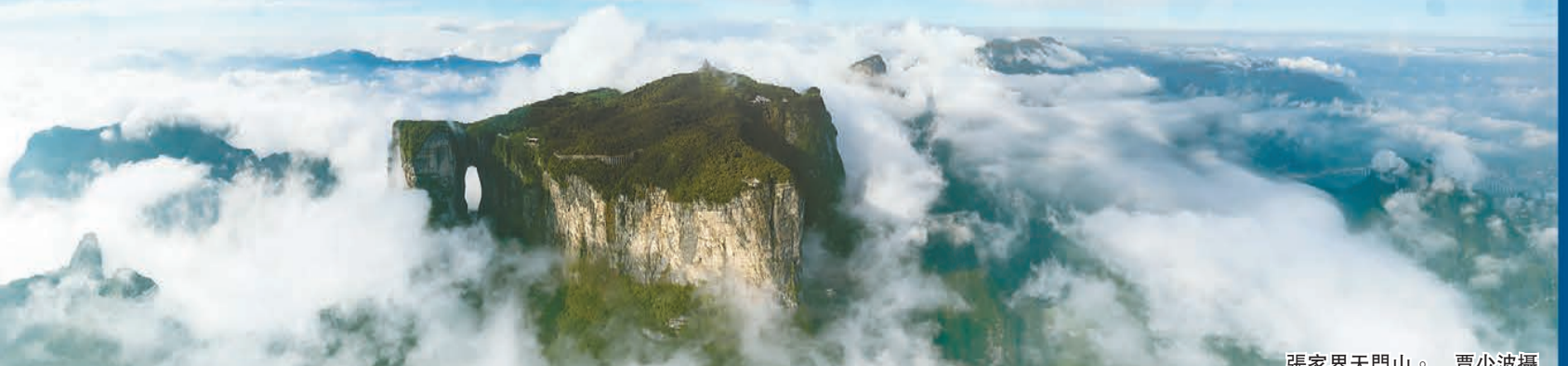
張家界天門山。

9月5日，湖南省委、省政府出台《關於加快建設世界旅遊目的地的意見》，其中提出，到2025年，全省旅遊總收入達到1.1萬億元以上，接待遊客7.5億人次以上，人均消費1500元以上，旅遊增加值佔地區生產總值的6.5%；培育1家千億資產旅遊企業和3至4家百億資產旅遊企業，建成2至3處世界級旅遊景區、世界級旅遊度假區，初步形成具有全球吸引力的旅遊產品體系。