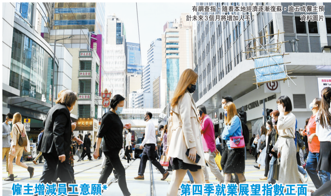
有調查指，隨着本地經濟逐漸復蘇，逾五成僱主預計未來3個月將增加人手。