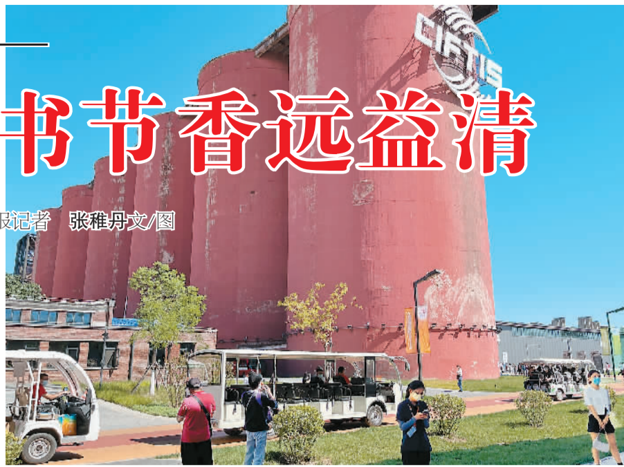
首钢园区最醒目的建筑——煤仓