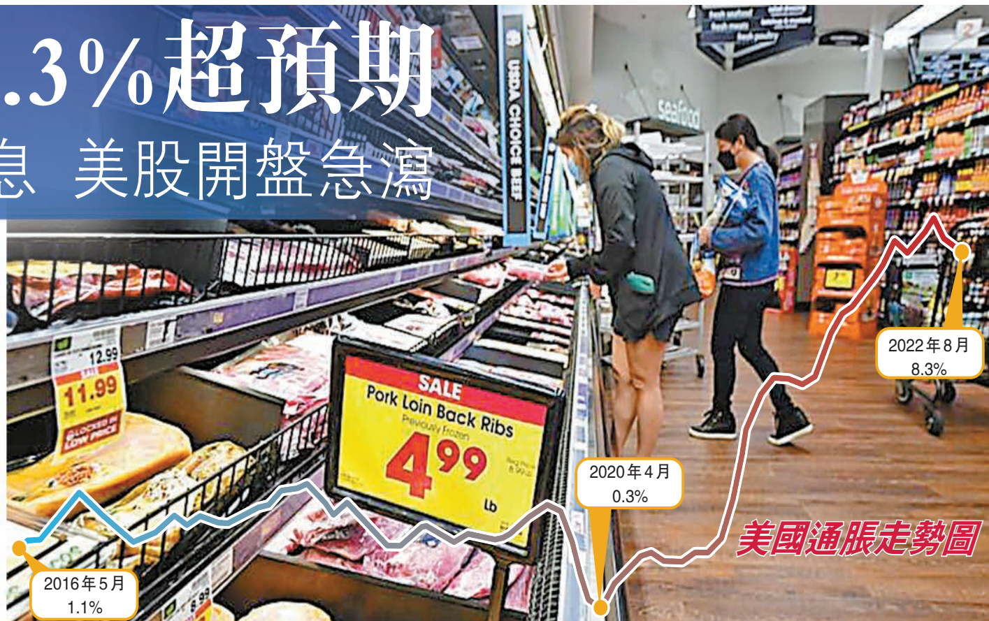
美國8月食品價格按年上漲超過11%，升幅是1979年以來最多。

【香港商報訊】美國勞工部昨天公布最新8月份通脹數據，消費物價指數(CPI)按年升8.3%，高過市場預期的8.1%。撇除能源及食品的核心CPI按年升6.3%，同樣高過預期。通脹數據超預期，市場對聯儲局下周大手加息的預期升溫。反映利率期貨市場的芝商所FedWatch工具顯示，市場押注聯儲局下周加息0.75厘的機率為80%，而加息1厘的機率則為20%。美國8月CPI數據公布後，美股開盤急挫。截至本港時間昨晚11時10分，道指大瀉864.86點(2.67%)，報31516.48點。