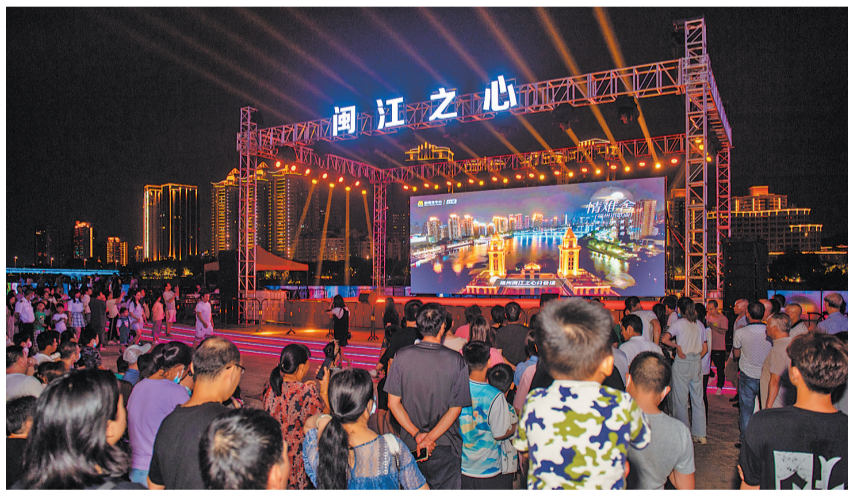
福州市民观看“闽江之心”中秋电影云歌会。

【福州晚报讯】12日,由中国央视电影频道节目中心、福州市委宣传部联合主办的“明月知我”——“闽江之心”中秋电影云歌会圆满收官,节目观看总量达到1.02亿次,相关话题阅读量超6亿次,打造了31个全平台热门话题。