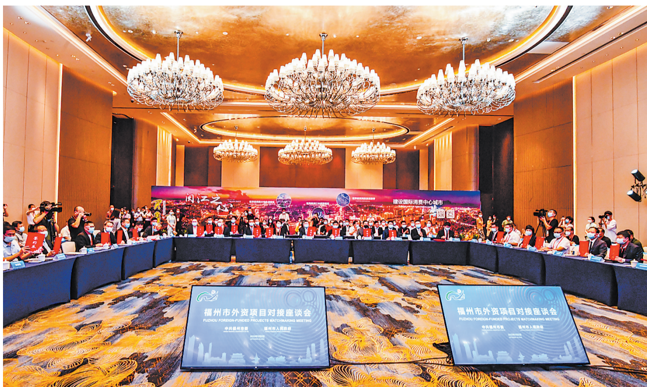
外资项目签约现场。

“希望广大外资企业深度融入福州发展,把更多优质项目落户福州,在新起点上携手合作。我们将全力做好签约项目跟踪服务,全程靠前帮办,争取项目早开工、早投产、早达效。”福州市商务