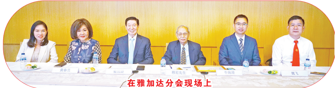
在雅加达分会现场上