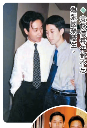
◆袁詠儀每年都不忘為張國榮慶生。