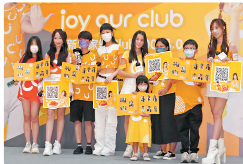
◆After Class深受粉絲歡迎及愛戴。

剛癒病的Gigi是否正式全面復工?她表示看公司安排,不過今日她會照常返學,至於何時才上台唱歌,她會