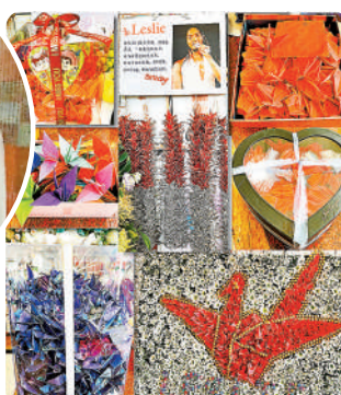
◆各地「哥」迷親手製作千羽鶴給哥哥。

陳太並透露,她正在籌辦連串的二十周年紀念活動,包括展覽會及明年4月1日於紅館舉行的音樂會,希望藉着舉辦多種類的活動,能夠讓香港及遠道來港的「哥」迷帶着豐富及滿滿的回憶。