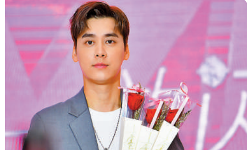
◆李易峰因涉嫌多次嫖娼近日被行政拘留。