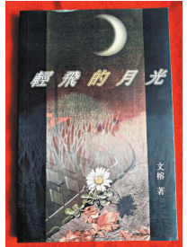
◆ 文榕《輕飛的月光》書影。作者供圖

她的詩文清秀，蘊含着濃濃詩意；她筆下所寫的光尤有深意；在清淺幽美的詩行裏，既充滿溫暖的天真之趣，又寓有悠遠的生命哲思，富於情味，令我珍愛！