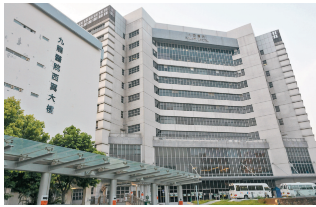
◆香港九龍醫院胸肺內科病房日前有1名病人染疫，及後發現同房再有2名病人染疫。圖為九龍醫院。