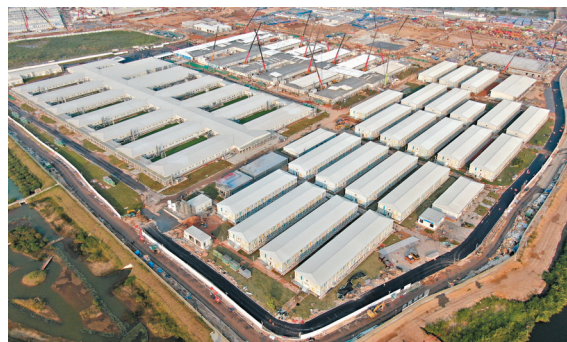
◆鄧炳強指，河套區檢疫設施有約4,000個單位，共提供約10,000張床，可作為「逆隔離」的起點。圖為落馬洲河套區檢疫設施。資料圖片