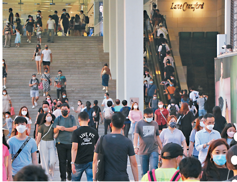
◆張竹君表示，未知中秋節假期後確診數字會否反彈。圖為中秋假期尖沙咀海港城商場外人頭湧湧。

其中46歲的男死者，未打疫苗，生前患高血壓、糖尿病及哮喘，雖然快測及核酸均呈陽性，但其死因估計是心肌梗塞和大範圍中風導致。