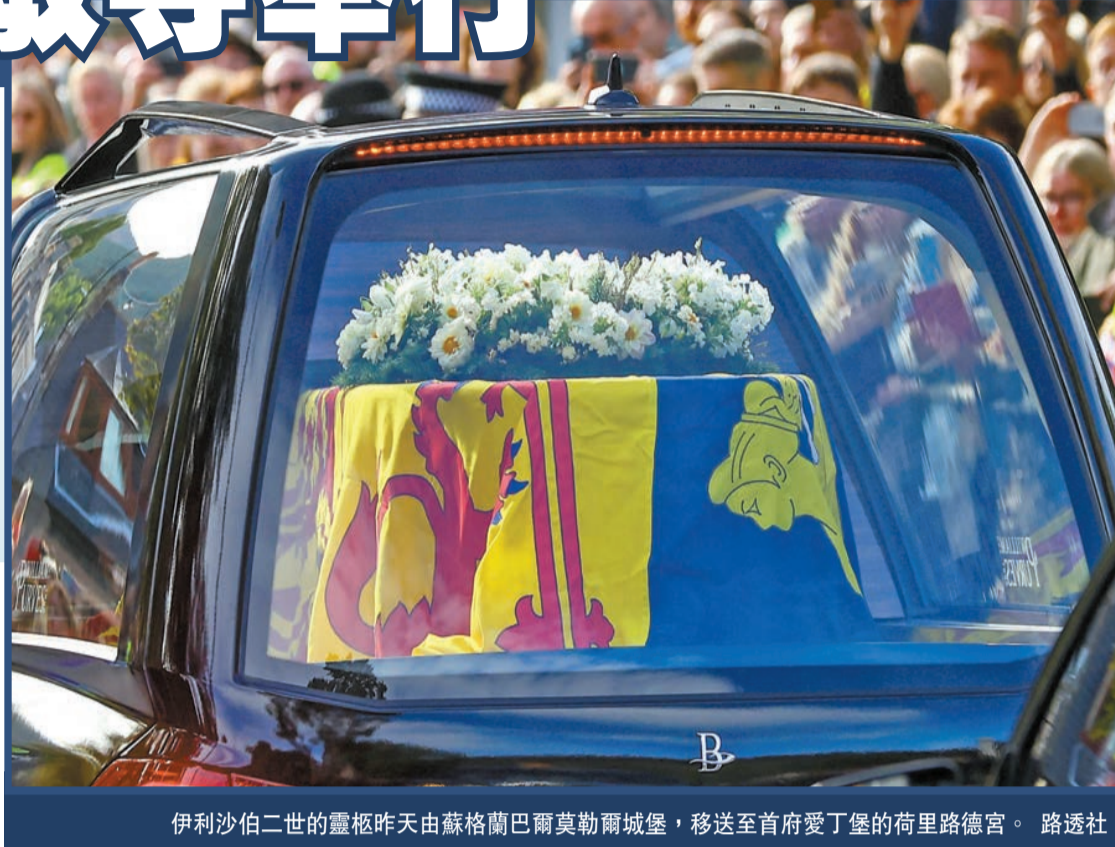
伊麗莎白二世的靈柩昨天由蘇格蘭巴爾莫勒爾城堡，移送至首府愛丁堡的荷里路德宮。

【香港商報訊】英國白金漢宮當地時間10日宣布，英女王伊麗莎白二世的國葬將於19日在倫敦西敏寺舉行。登基成為新國王的查里斯三世及王后卡米拉會於今日(12日)前往蘇格蘭首府愛丁堡，查里斯三世和部分王室成員會於下午徒步扶靈至聖吉爾斯大教堂，並會在晚上7時許舉行守靈儀式。靈柩在周三安放於倫敦西敏宮，周四起讓公眾瞻仰。查里斯三世宣布，國葬當日為公眾假期。