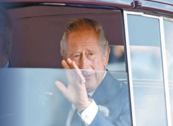
查里斯三世昨天抵達白金漢宮時，向群眾揮手。