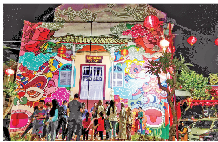
多名市民在典型的中华壁画前拍照