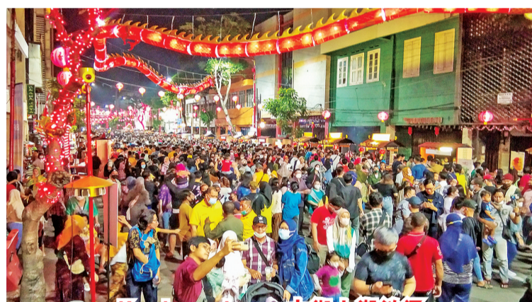
Kembang Jepun 大街人潮汹涌