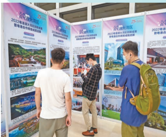
廣州市民在巡展現場了解增城區的發展成果。