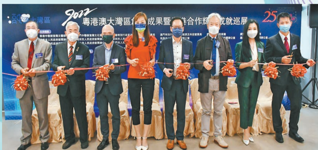
香港站巡展開幕式

9月5日—11日，為慶祝香港回歸祖國25周年、香港商報創刊70周年，深入推進粵港澳大灣區建設，更好地向海內外展示大灣區建設成果，由香港商報承辦的「2022粵港澳大灣區創新成果暨粵港合作輝煌成就巡展」分別在香港和廣州展出。