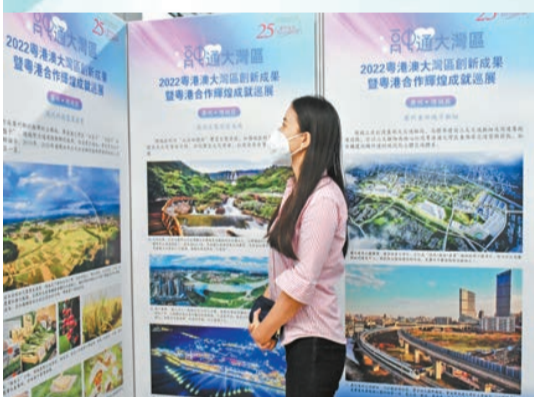
香港市民在巡展現場了解增城區的發展成果。