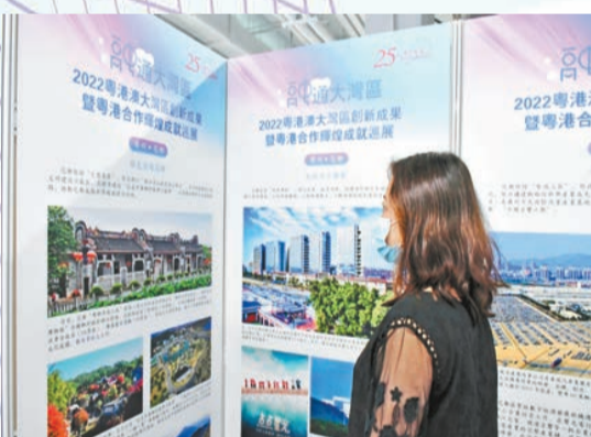
香港市民在巡展現場了解花都區的發展成果。