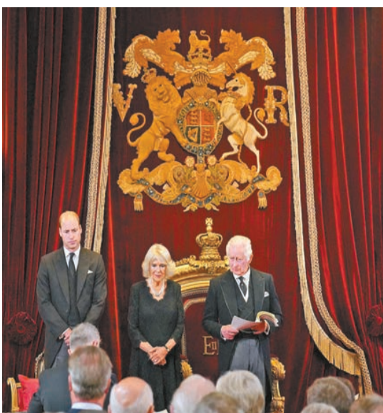
查理斯三世（右一）在聖詹姆斯宮正式宣誓登基成為英國新君主，威爾士親王威廉、王后卡米拉出席儀式。

【香港商報訊】據央視新聞報道，當地時間9月10日，英國國王查理斯三世在聖詹姆斯宮正式宣誓登基成為英國新君主。