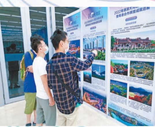
廣州市民在巡展現場了解花都區的發展成果。