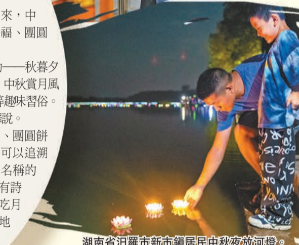
湖南省汨羅市新市鎮居民中秋夜放河燈。