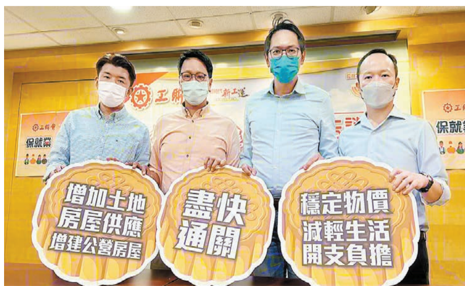
工聯會一項調查發現，近七成市民最期望盡快通關。

【香港商報訊】記者戴合聲報導：行政長官李家超將於下月發表首份施政報告，工聯會舉行「最期望特區新班子解決的10大民生問題」網上問卷調查發現，