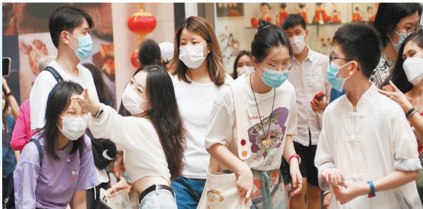
市民昨天開始享受中秋假期，惟確診數字仍高企，政府呼籲市民盡快接種疫苗。

及185宗輸入個案，再多8名患者離世，衛生署衛生防護中心再次呼籲市民避免參與跨家庭聚會。因應疫情升溫，公務員事務局局長楊何蓓茵昨日在社交平台發文，強調疫情升溫，疫苗接種具迫切性。她呼籲市民做「說客」，勸導親友盡快接種疫苗，而各社區疫苗接種中心在節日期間仍照常開放。瑪嘉烈醫院兒童傳染病科顧問醫生關日華指出，無打針的兒童在確診後變重症的風險高很多，呼籲家長盡快帶子女打針。