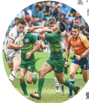
圖為2019年香港隊與愛爾蘭隊比賽情景。

楊潤雄表示，過去一星期，平均每日有過萬宗確診個案，在科學考量下，舉辦大型體育賽事會面對困難，若賽事期間有多人同時除下口罩，傳播風險較高。但若賽事只有少量運動員參與，其餘人士是觀眾，風險相對會較低。