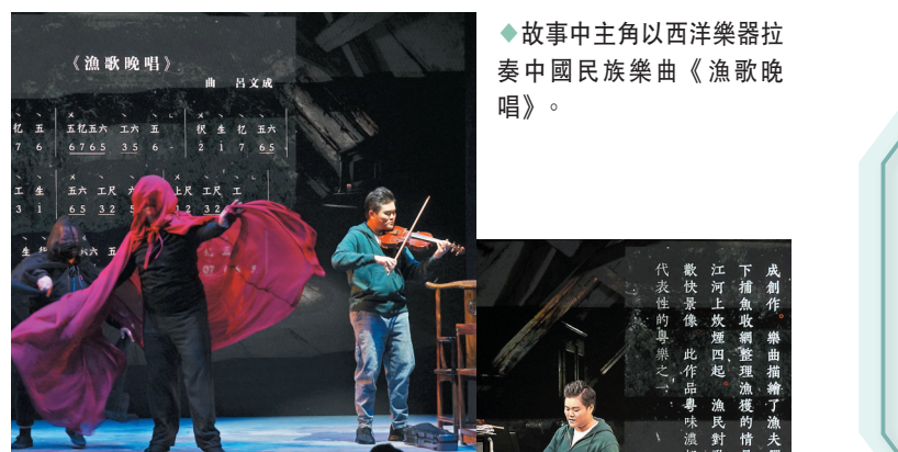
◆故事中主角以西洋樂器演奏中國民族樂曲《漁歌晚唱》。