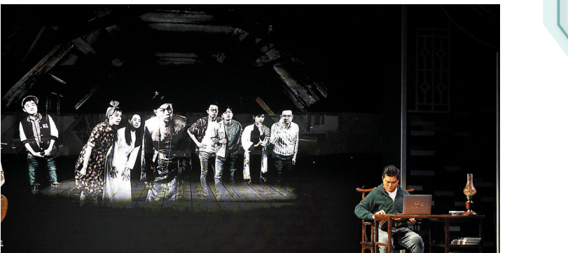
◆舞台上使用了影像投射技術。