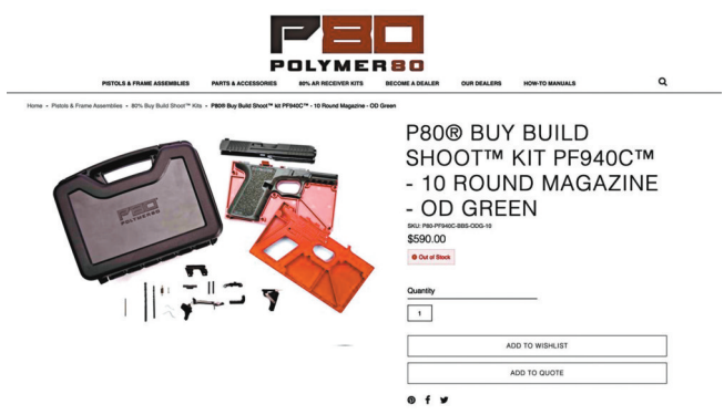
◆Polymer80屢次躲過監管。

換言之，除非美國國務院在現屆政府的指示下，重新將「幽靈槍」設計圖列入名單，否則這些設計圖今後都可以在美國合法地公開，並且散布至全球。 ◆綜合報道