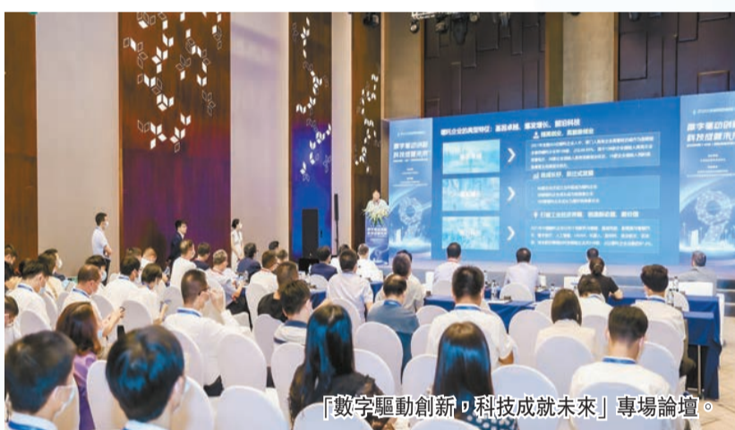
「數字驅動創新，科技成就未來」專場論壇。