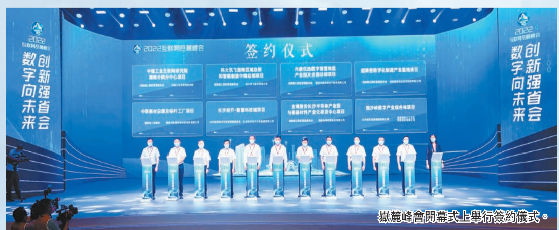
嶽麓峰會開幕式上舉行簽約儀式。