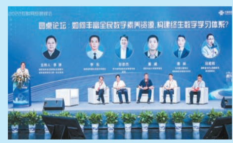
「提升數字素養，助力網絡強省」專場論壇。

今年5月，數字湖南領導小組印發實施《湖南省新型數字基礎設施建設「十四五」規劃》。到2025年，湖南省5G基站數將達到15萬個，移動網絡IPv6流量佔比達75%，移動物聯網終端用戶達4000萬戶。