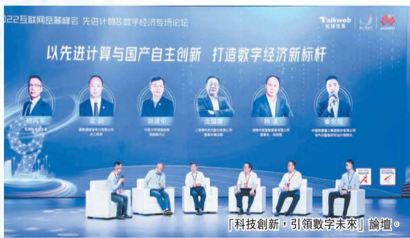
「科技創新，引領數字未來」論壇。