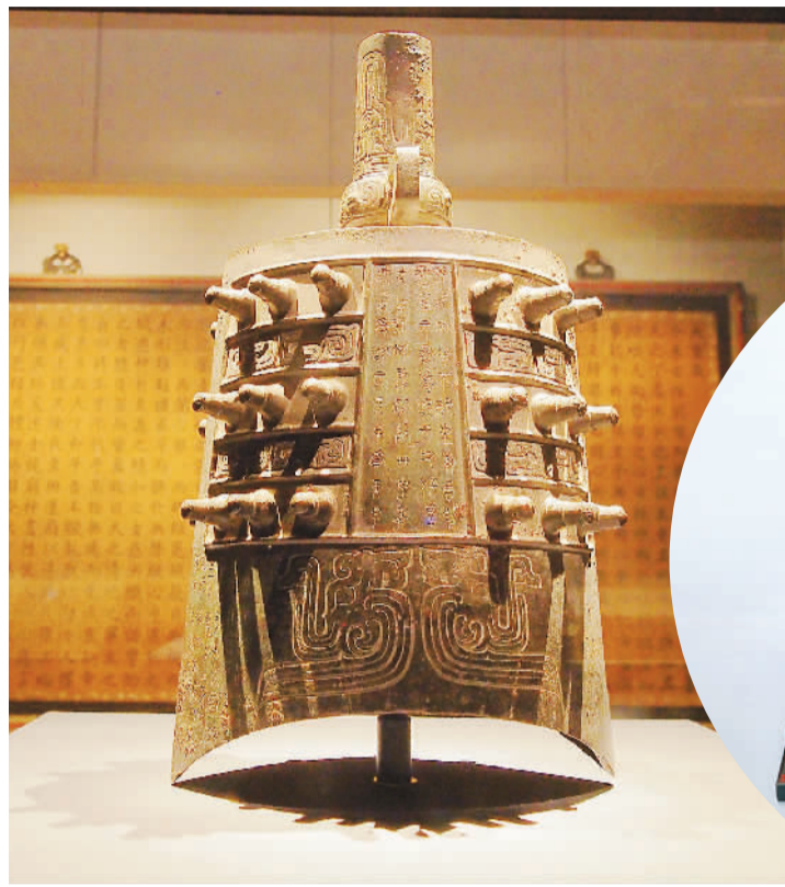
▲西周饗叔旅钟。 ▼清乾隆帝题花卉诗管紫毫笔及笔匣。