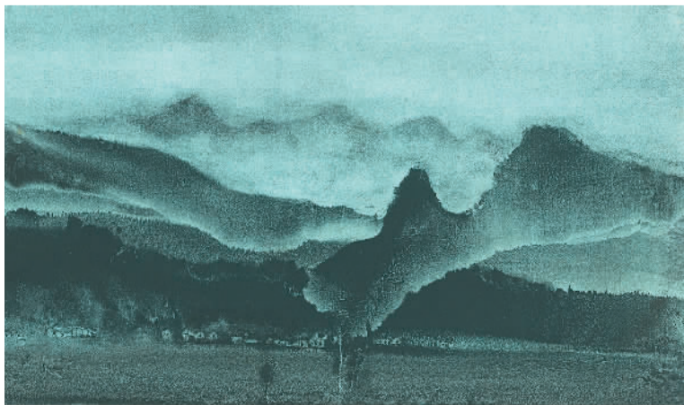
木心纸本彩墨作品《会稽春明》（局部）。