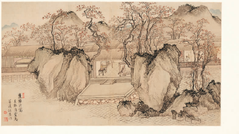
明唐寅《双鉴行窝图》。