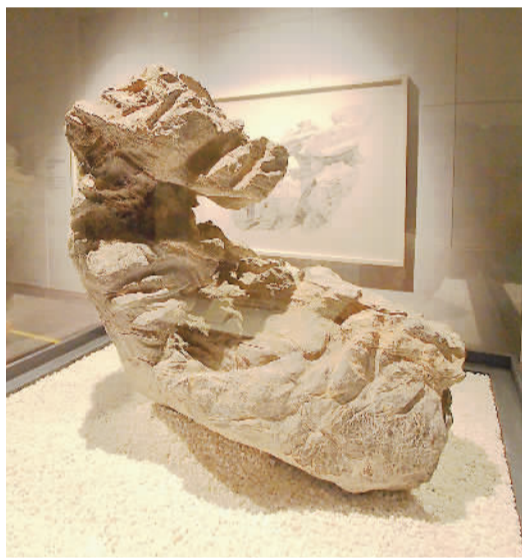
元代造云石。

（石涛）的作品。图绘重嶂密树，溪桥城阙，屋舍隐约，小路蜿蜒，好一派北方山川雄浑壮阔的景象。题名“搜尽奇峰打草稿”与图后所写长跋，表达了画家师法自然的创作思想。