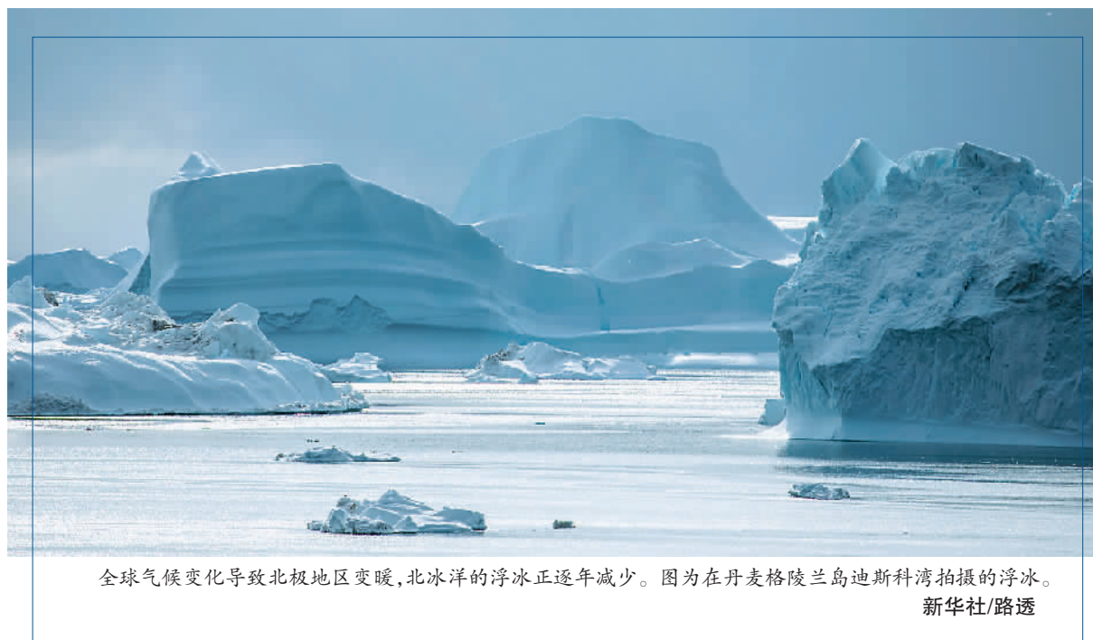
全球气候变化导致北极地区变暖，北冰洋的浮冰正逐年减少。图为在丹麦格陵兰岛迪斯科湾拍摄的浮冰。

美国国务院日前发表声明，宣布美国计划任命一名负责北极地区事务的无任所大使，并称该地区对其“具有至关重要的战略意义”。北约秘书长斯托尔滕贝格在8月下旬访问加拿大期间宣称，俄罗斯和中国在北极地区的合作不符合北约国家利益，因此北约将加强在该地区的存在。