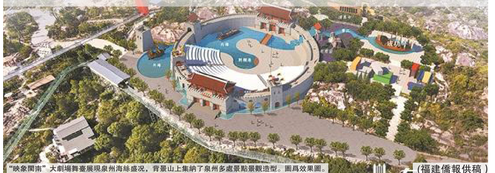
“映象閩南”大劇場舞臺展現泉州海絲盛況,背景山上集納了泉州多處景點景觀造型。圖為效果圖。

此外,7個教育補短板項目,將解決豐州學位緊缺問題,增加幼兒園800多個學位、小學300多個學位、初中200多個學位。