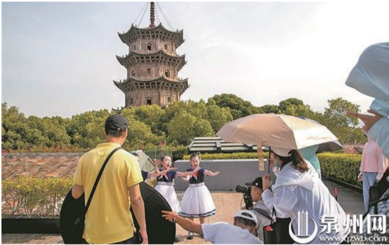
2022年《開學第一課》在CCTV-1播出,泉州少年在節目中亮相。圖為央視攝制組在泉州西街進行取景拍攝。