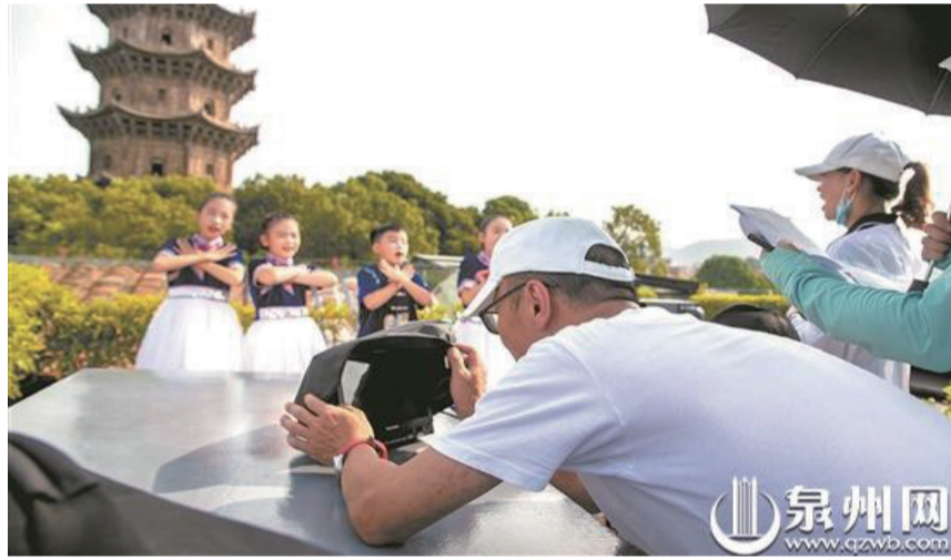
攝制組在古城西街取景拍攝

泉州網訊(記者 龔翠玲 通訊員 吳君凡 張義 王育澤 文/圖)1日晚,央視《開學第一課》如約而至,泉州市青少年宮僑鄉少兒藝術團合唱團作為福建省唯一代表,參與了《我愛你中國》和《我們都是追夢人》兩個合唱節目的攝制,向全國億萬觀眾展現了泉州深厚的文化底蘊和新时代泉州青少年的良好風貌。