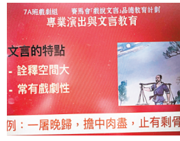
例：一屠晚歸，攬中肉盡，止有剩骨

一休在此計劃的大膽創新設計，及在實踐中亦證明了非常有效，得到各參加學校師生的讚許。期望有更多學校和師生可以參加，也在實踐中共同研發出更能讓學生終身受益的文言文學習。期待能實現，互勉！