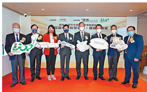
◆ 開幕當天設研討會討論。

為了進一步提升醫療質素，集團近年更積極研究引入AI人工智能會診及大數據分析，期望能運用醫術和科技推行更有效針對個人病症的「精準中醫」。除了提供中醫專科診療外，集團亦引入現代化中醫藥管理，以及安排註冊物理治療師、註冊營養師和體適能教練等其他領域的專業人才與中醫師攜手為病人提供療治，針對都市人各種常見健康問題，如三高、痛症及脫髮、中西合璧制定全方位專業醫療