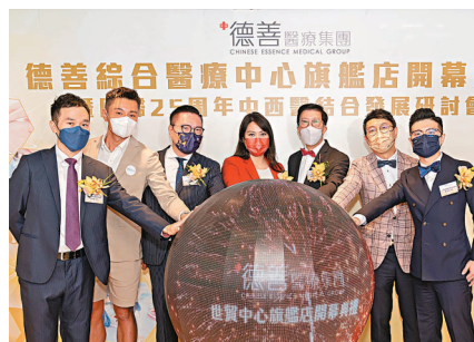
◆ 德善綜合醫療中心日前開幕。

有別於坊間普通中醫診所由一位醫師作全科診斷的形式，德善集團集結了眾多中醫藥界精英，成立專科醫療團隊，提供腫瘤科、心臟血管科、婦科、皮膚科及內科等中醫專科服務，提供更全面及具針對性的診治，全力推動「精準中醫」，在銅鑼灣世貿中心開設最新德善綜合醫療旗艦中心，並於日前正式開幕。