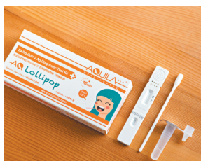
◆ AQ Lollipop