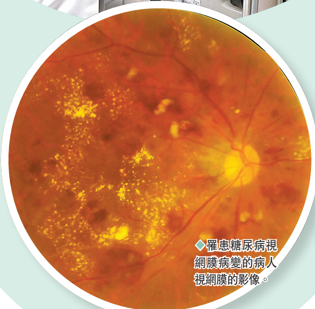
◆ 罹患糖尿病視網膜病變的病人的視網膜影像。

除了有上述單純期病變外，還有新生血管和纖維組織形成，且易發生反覆性玻璃體出血，並可引起繼發性視網膜脫離。當視網膜或視盤表面出現新生血管時，DR則進入增殖期。