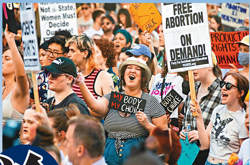
美國的政策正在分裂，特別在有關墮胎權等重要議題上。資料圖片