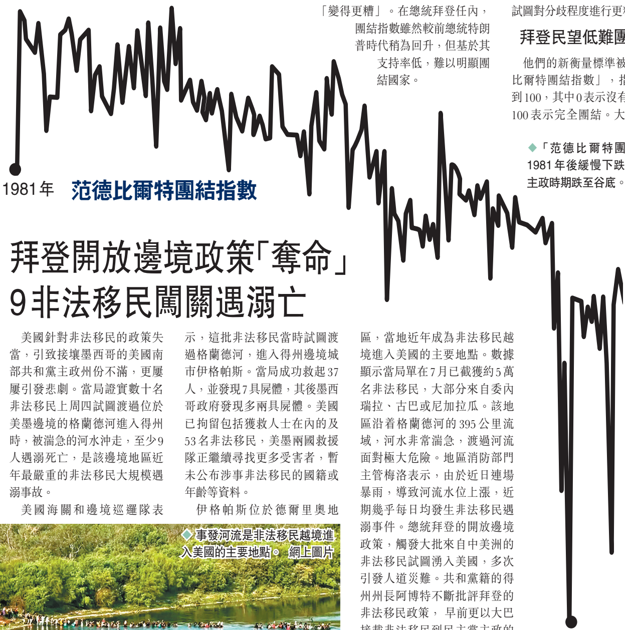
1981年 范德比爾特團結指數