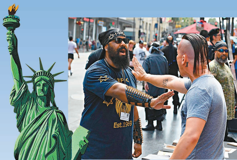
美國社會撕裂加劇，兩派人士屢發生衝突。資料圖片