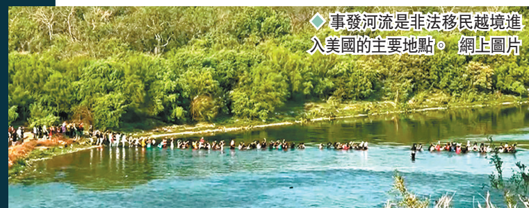
事發河流是非法移民越境進入美國的主要地點。