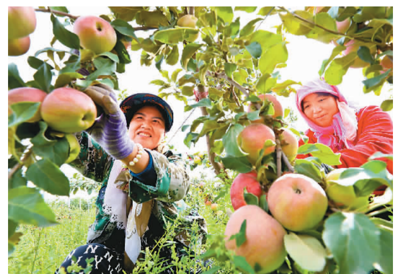
目前，位于祁连山下的甘肃省张掖市民乐县工业园区戈壁农业机械化密植苹果示范基地，300多亩密植苹果进入成熟采摘期。果农们忙碌着采摘、挑选、搬运和冷藏丰收的果实，果园内到处是一派忙碌喜悦的景象。图为果农采摘机械化密植嘎啦苹果。

（CDD）指数。其中，以北京为代表的华北地区为玉米、小麦重要产区，以哈尔滨为代表的东北地区是大豆和玉米主要产区，相关温度指数可以较为有效地表征大豆和玉米等作物生长气温情况。今后，宏观管理部门可以参考该指数，为农产品保供稳价制定更加精准的政策；农业生产者可以根据该指数评估收获季的产量和价格，从而提前制定生产经营计划和风险管理计划。