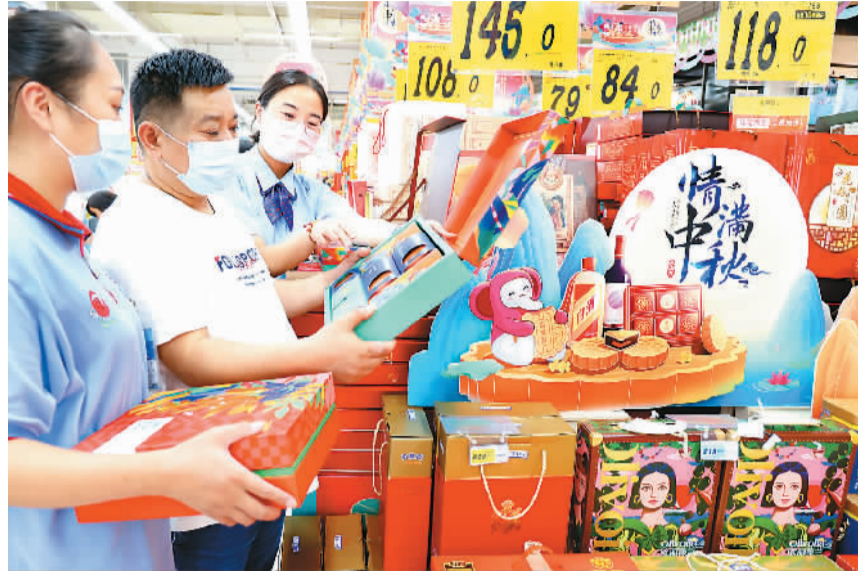
中秋节临近，安徽省淮北市各大商场超市传统食品购销两旺，节日气氛浓厚。图为在淮北市淮海路大润发大型超市内，市民在“中秋大街”卖场选购月饼。

旅游消费更新潮多样。中秋集市、汉服游园、花灯船宴……中秋小长假期间，国内多个目的地及景区将推出多种体验类活动，为游客的文