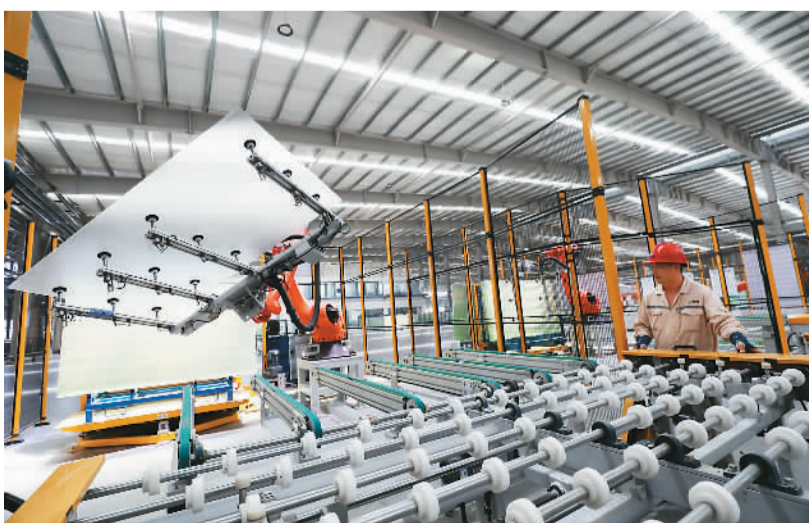
近年来，湖南省资兴市依托大储量、高品位的硅石矿源优势，大力发展硅产业链上下游项目，推动县域经济快速发展。图为资兴市经济开发区资五产业园郴州旗滨光伏光电玻璃有限公司二期光伏组件高透基板材料生产车间。

科技创新能力明显增强。通过推动实施工业强基工程、出台国家新材料重点平台及首批次保险等政策，原材料工业研发投入强度由2012年的0.62%提高到2021年的1%左右，科技论文和发明专利数量全球第一，300余项材料技术获得国家科学技术奖。关键材料不断突破，超导材料领域具备全球唯一的全流程生产能力，有序