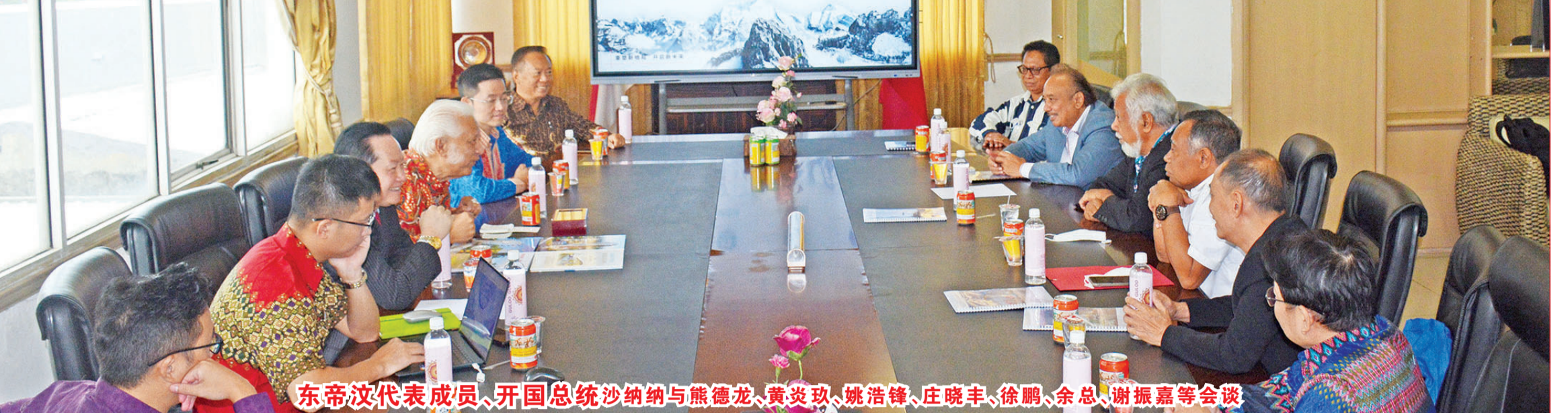
东帝汶代表成员、开国总统沙纳纳与熊德龙、黄炎玖、姚浩锋、庄晓丰、徐鹏、余总、谢振嘉等会谈

【本报讯】2022年9月4日(星期日)下午,东帝汶开国总统沙纳纳·古芒斯一行在国际日报大厦会议厅,与中国森田等中资企业洽谈有关投资合作事宜。