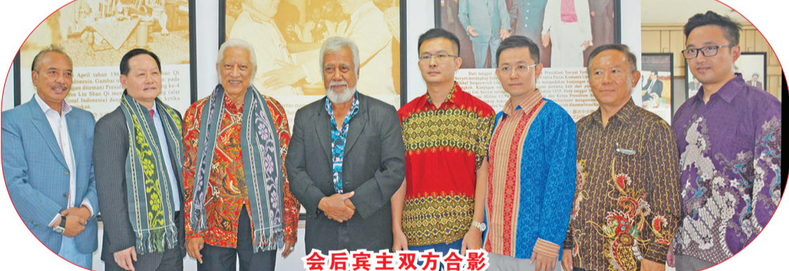
会后宾主双方合影