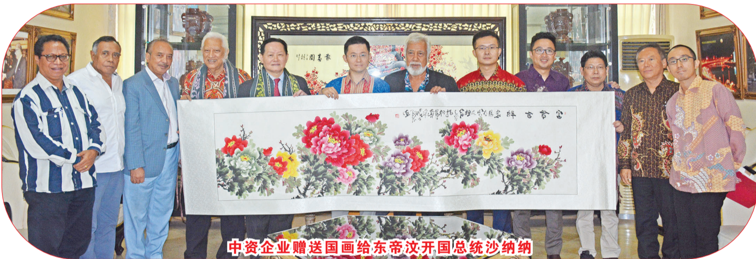
中资企业赠送国画给东帝汶开国总统沙纳纳

对于在东帝汶开发金融、农业、医疗、旅游、游乐,双方进行了深入交流。沙纳纳希望通过广泛的开发,繁荣当地经济,改善民生,提供人民的生活水平,并向中国与印尼借鉴