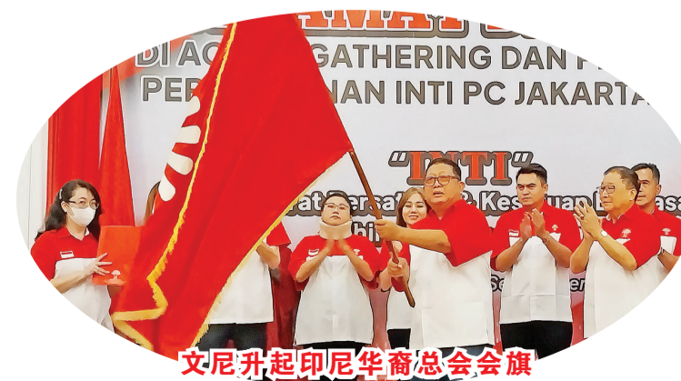
文尼升起印尼华裔总会会旗