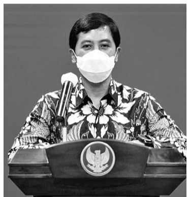
卫生部副部长丹德(Dante Saksono Harbuwono)

于两年期降级处分。 国家警察总部在一份声明中指出,这一步骤是总警长的一种承诺,通过打击从事犯罪活动的警员,惩罚一切警察部队的违规行为,特别是毒品和赌博。 雅京警区公共关系主人朱尔班上校(Endra Zulpan)于2022年1月申明,对苏加诺-哈达国际机场警局缉毒部警员进行了调查。当时,那些被调查的警员包括缉毒部主任及其下属。 但朱尔班没有详细说明他们面临的案件。目前,尚不清楚当时的调查是否与埃德温上校被解职事件有关。 朱尔班周一(31/22)指出,关于这些警员在其领域的职责,有违标准操作程序,他们犯了罪,有所偏离。所以,对他们进行了审理。 当时,朱尔班也没有提到埃德温上校参与此案。埃德温上校于2022年1月24日也被调动职务,但没有对其进行调查。 (亮剑)