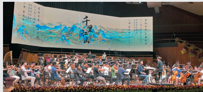
◆粵港澳三地音樂家共奏《千里江山》交響音詩 綵排現場。

江嘉敏。對於監製稱她們拍完此劇後變得熟絡,敏之笑道:「因為江嘉敏太喜歡吃,劇中我是火鍋店老闆,主景經常是吃火鍋,有展鵬、謝東閔等好飯友,日日食就吃出感情來。」已有一段時間沒新劇推出的敏之,表示《黯夜守護者》是她最後一套存貨,她說:「現在努力做自己的護膚品牌生意,如果有合適劇本都會拍,跟公司合約都差不多不要再怕,雖然我生仔後少拍了劇,但都想繼續有新作保持人氣,也可以過戲癮。」