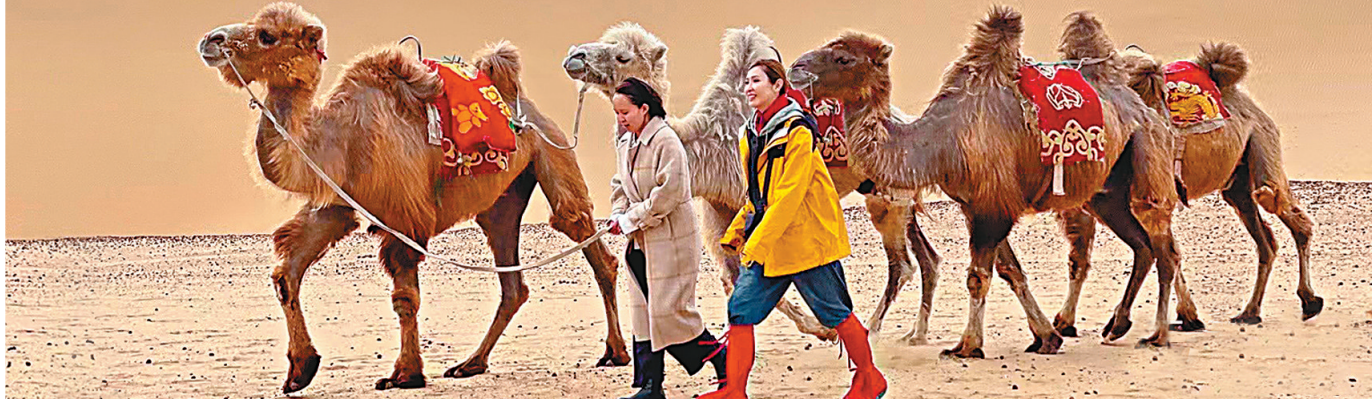
◆ 陳貝兒跟內蒙古庫布其沙漠駱駝隊浩浩蕩蕩前行。