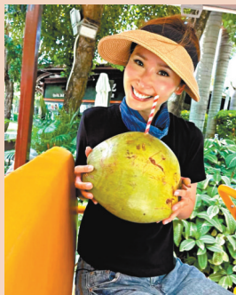
◆ 到節目拍攝殺青時，貝兒已曬得滿臉通紅。

貝兒在海南三亞下海潛水種植珊瑚，「海南是最後一站拍攝地，太陽要比想像中熱情太多。這一站需要潛水，自己並不懂得游泳，海南站是人生第一次潛水。拍