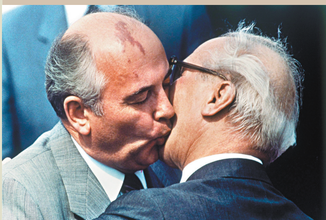
◆1987年5月27日，戈爾巴喬夫與前東德領導人昂納克在東柏林機場熱吻。