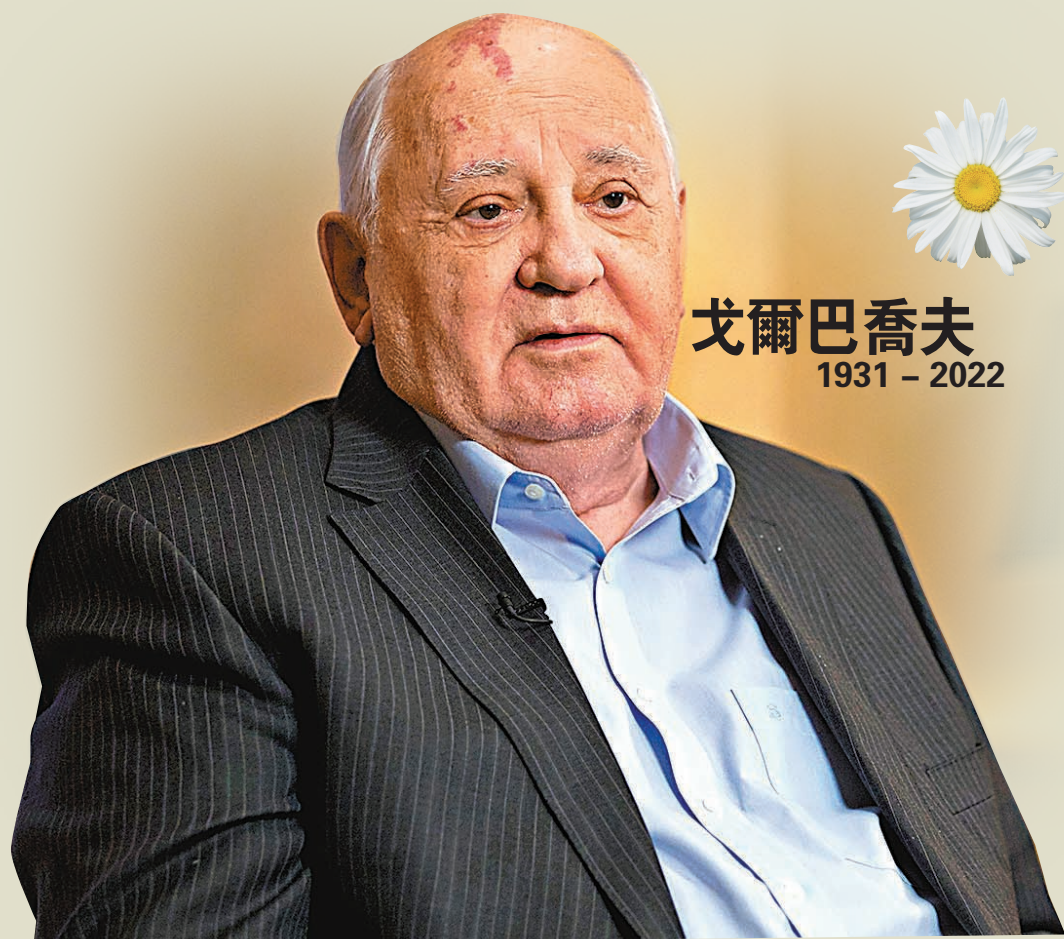
戈爾巴喬夫 1931 - 2022

俄羅斯聯邦總統事務局中央臨床醫院8月30日晚證實，蘇聯最後一任領導人戈爾巴喬夫因長期重病醫治無效於當晚去世，終年91歲。戈爾巴喬夫被視為二十世紀其中一位最具爭議性的政治人物，他在任內促成東西方冷戰結束，但他在國內備受爭議，其推行的連串政治和經濟改革並不順利，蘇聯經濟其後陷入衰退，人民生活水平下降，不少俄羅斯人認為他要為蘇聯解體負責。