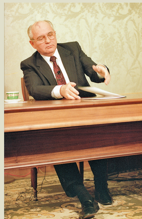
▼1991年12月25日晚上7時，戈爾巴喬夫在克里姆林宮向全國作電視直播宣布辭職，劉香成拍下戈爾巴喬夫放下講稿的一刻。

作電視直播，劉香成因得到美國有線新聞網絡（CNN）總裁的關照，成為極少數能持證進入直播現場的記者。劉香成當時距離戈爾巴喬夫只有幾米遠，他拿着相機把快門校到1/30秒，戈爾巴喬夫看着前方鏡頭說出最後一句話：「謹此向各位致以我最美好的祝福！」劉香成舉起相機拍下，戈爾巴喬夫身體微傾，手裏的講稿落向桌面，代表着一個時代的結束。 ◆綜合報道