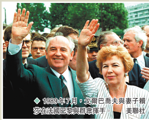
◆1989年7月，戈爾巴喬夫與妻子賴莎在法國巴黎與群眾揮手。