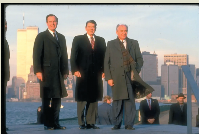
◆1988年12月，戈爾巴喬夫訪美，與老布希（左）及時任美國總統里根（中）在紐約合影，背景為曼哈頓天際線。

克里姆林宮發言人佩斯科夫8月31日表示，總統普京對戈爾巴喬夫的去逝表示深切哀悼。戈爾巴喬夫將於周六舉殯，遺體將遵照戈爾巴喬夫意願，被安葬在莫斯科新聖女公墓，緊鄰亡妻賴莎的墓地。 ◆綜合報道