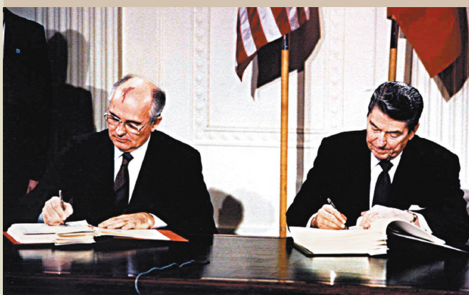
◆1987年12月8日，戈爾巴喬夫與里根在白宮簽署《中程導彈條約》。