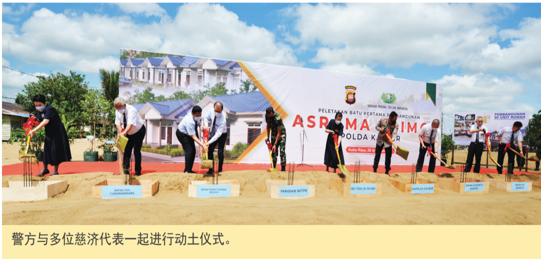
警方與多位慈濟代表一起進行動土儀式。