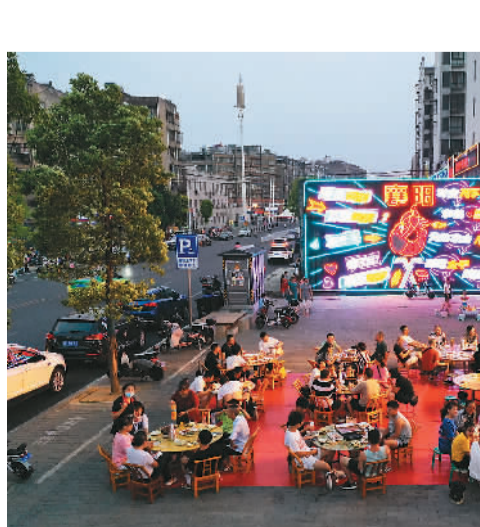
湖北省武汉市襄城区闸口路曾是有名的美食街，今年以来夜市餐饮业市场冷淡。襄城纪检部门积极协调相关职能部门想办法、拿措施，在各部门的共同努力下，该夜市再次红火起来。图为市民在闸口路美食街就餐。

据新华社北京8月29日电（记者张泉、李国利）记者从29日在北京和上海同时举行的载人航天工程空间应用暨空间站高等植物培养实验阶段性进展情况介绍会上获悉，中国空间站问天实验舱内的拟南芥和水稻种子萌发已成功启动，目前生长状态良好，后续将开展拟南芥和水稻在太空“从种子到种子”全生命周期实验。2022年7月，问天实验舱成功发射并与天和核心舱交会对接，7月28日，载有实验样品拟南芥种子和水稻种子的实验单元，由航天员安装至问天实验舱的生命生态通用实验模块中，通过地面程序注入指令于7月29日启动实验。目前拟南芥幼苗已长出多片叶子，高秆水稻幼苗已长至30厘米左右高，矮秆水稻也长至5至6厘米高。“此前，我国已成功完成过拟南芥在太空‘从种子到种子’全生命周期实验，希望通过本次研究，在国际上首次完成空间微重力条件下水稻‘从种子到种子’全生命周期的培养实验，并获得水稻培养的关键环境参数，为利用水稻进行空间粮食生产提供理论指导。”中国科学院分子植物科学卓越创新中心研究员郑慧琼说。据介绍，在过去60余年中，科学家对于在空间种植和栽培植物进行了大量研究，当前研究重点逐渐由对植物幼苗阶段的研究扩展至种子生产研究，但目前只有油菜、小麦、豌豆等少数几种作物在空间完成了“从种子到种子”的实验。