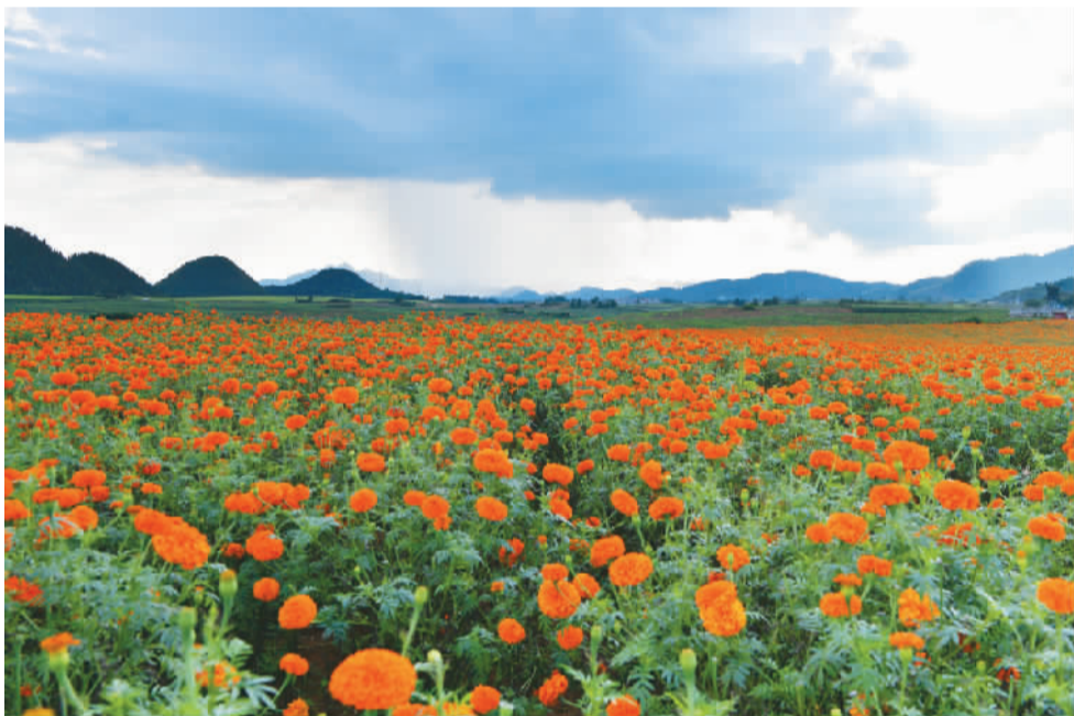
近年来，云南省曲靖市罗平县以“花”为媒，大力发展“花”经济，农民靠“花”经济鼓起钱袋子。图为8月29日，罗平县板桥镇金鸡村的万寿菊花海。