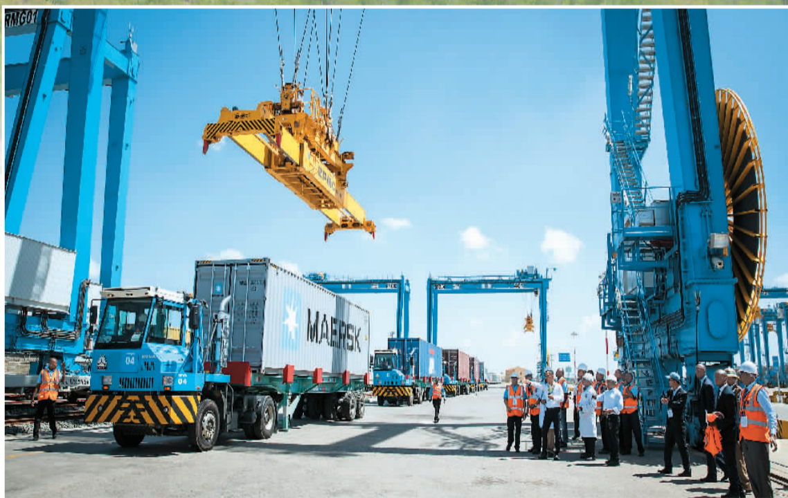
▲ 过去5年，蒙内铁路累计运送集装箱177.3万标箱，目前日均开行16列货运列车，促进了肯尼亚本国以及与其他东非国家的经贸往来。因为肯尼亚铁路项目重要配套工程内罗毕内陆集装箱港一派繁忙。