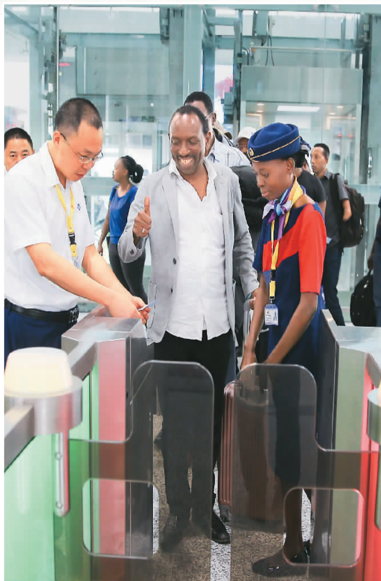
▲ 在肯尼亚蒙内铁路蒙巴萨西站，工作人员协助乘客使用自动闸机检票，乘客竖起大拇指。

蒙内铁路为肯尼亚创造近5万个就业岗位，培养了1700余名高素质铁路专业技术和管理人才。