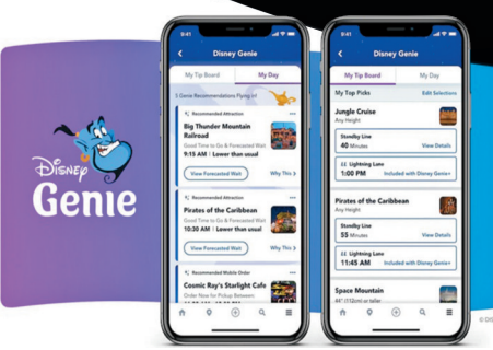
◆「Genie+」服務可以讓遊客預訂熱門設施景點。