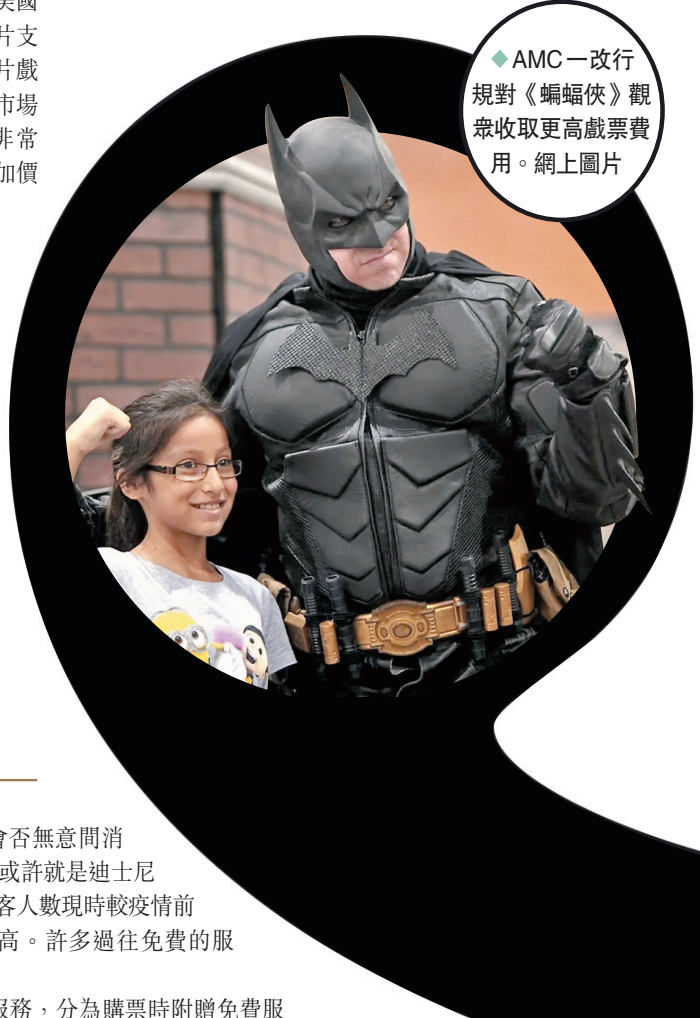
◆AMC一改行規對《蝙蝠俠》觀眾收取更高戲票費用。