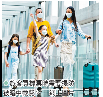
◆旅客買機票時需要提防被暗中徵費。網上圖片

接機送機也成為機場加徵費用的選項。英國汽車服務公司RAC統計當地22座主要機場中，多達16座都較疫情前調高所謂送機費，即搭機者由親朋駕車送到機場、然後停車放下搭機者所收取的費用。其中要價最高的倫敦斯坦斯特德機場停留15分鐘，就要收費7英鎊，較2019年的10分鐘4英鎊明顯增加。包括英國最繁忙的希思羅和蓋特威克機場在內，8座機場每次送機費也要5英鎊，蘇格蘭的愛丁堡、阿伯丁和格拉斯哥機場送機費在3年間更齊齊翻倍，停留10分鐘須收費4英鎊。