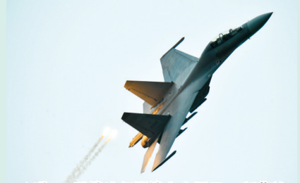
◆殲-16戰機進行單機空中展示。