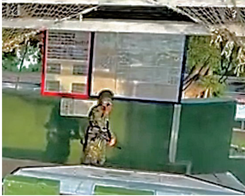
◆據台媒報道，大陸無人機日前再飛入金門台軍崗哨進行近距離拍攝。

台防務部門對此表示，將於明年獲得無人機防禦系統，屆時優先部署在外島地區。對於台軍的這項計劃，島內軍事專家批評，基層官兵沒有資源，台軍「無能無作為」。也有學者稱，面對大陸「灰色地帶」戰術，台灣不能再模糊應對，應儘快建立無人機防禦。