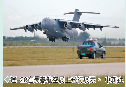
◆運-20在長春航空展上飛行展示。

他指出，運-20的拓展應用前景十分廣闊。隨著對飛機的不斷深入研究改進，運-20飛機性能將更加優異，運-20家族也會不斷發展壯大，終將與其他新型戰機一同成為載入史冊的一代名機。