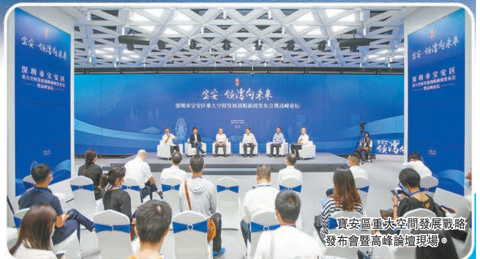
寶安區重大空間發展戰略發布會暨高峰論壇現場。