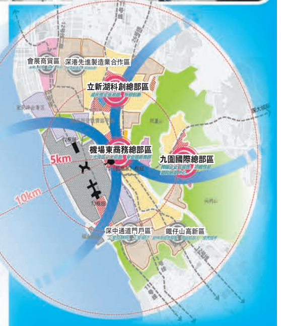
機場東臨空經濟結構圖。