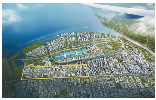
深港先進製造業合作區。