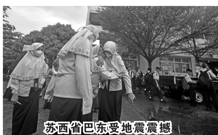
苏西省巴东受地震震撼

在银行合并或整合计划的情况下建立银行业务集团,不将在合并后显著增加对银行的业务规模,但必须仍然遵守规定。在银行业务集团的形成中,有必要关注被认为能够满足银行业务集团成员的资