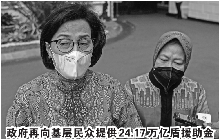
政府再向基层民众提供24.17万亿盾援助金

巴淡航空技术公司也乐观地认为,将根据可持续工作规划,加强对其当前能力的利用和优化,以实现飞机维修一体化,从而减少到国外进行各种的维修工作。(Sm)