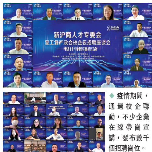
◆ 疫情期間，通過校企聯動，不少企業在線帶崗宣講，發布數千個招聘崗位。

上述《報告》還指出，UP主職業化已成為新趨勢，調研顯示視頻UP主成為00後最想從事的新興職業。在B站上，進擊的鐵木君、小透明TM、凹凸賽克等都已全職UP主，創業、副業相關視頻在B站也增速迅猛。其中，創業相關視頻播放量超8.3億，增速77%。副業成為新趨勢，相關視頻播放量增速達161%。博主、開店、剪輯等副業在B站擁有最多投稿。