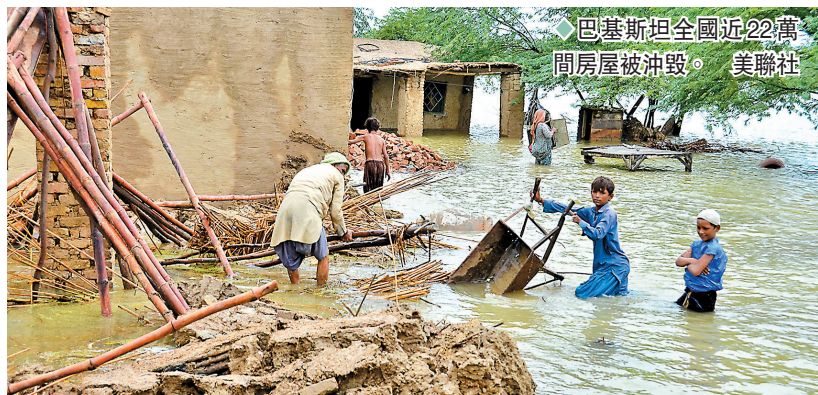
爾市視察，他下令軍方全力投入救援行動。

南部的俾路支省及西部的信德省均經歷60年來最嚴重水災，本年至今降雨量較過往同期平均高出逾3至4倍，部分公路及主要橋樑被沖毀，鐵路被迫停運。信德省救災機構表示，該省有80萬公頃農作物被毀，許多農民失去生計，有農民更形容生計從未見過如此嚴重的洪水。夏巴茲·謝里夫到信德省的蘇庫