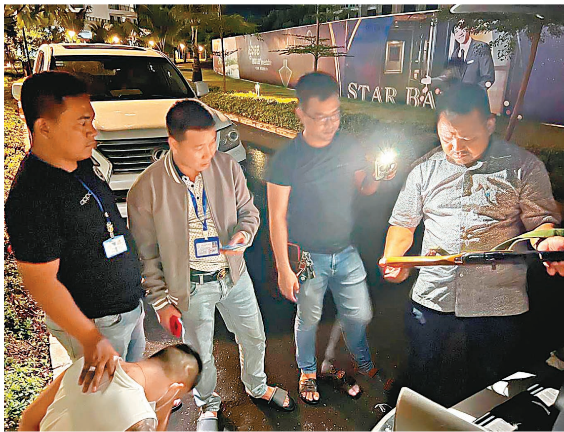
東埔寨警方近周偵破7宗案件，救出25名受害者。