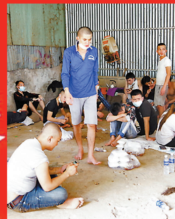
部分脫離魔掌的受害者。