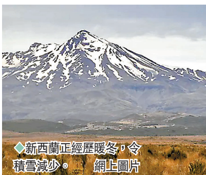
新西蘭正經歷暖冬，令積雪減少。網上圖片