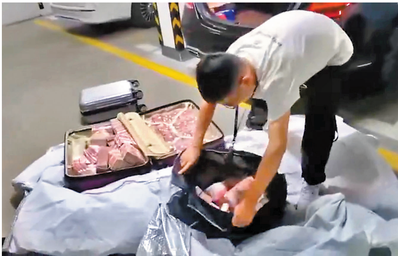
◆安徽合肥警方在清點涉案贓款。

公安部有關負責人表示，公安機關將始終保持嚴打高壓態勢，不斷創新打擊模式，繼續組織開展華南片區、京津冀片區等區域會戰，一仗接着一仗打，堅決遏制電信網絡詐騙違法犯罪多發高發態勢。