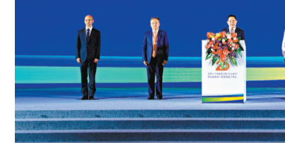
◆8月27日，以「堅持一個中國原則和『九二共識』，共創國家統一和民族復興偉業」為主題的2022年 global 華僑華人促進中國和平統一大會，在成都舉行。大會通過並發表《成都宣言》。

大會通過了《成都宣言》，強調一個中國原則不容挑戰、兩岸關係和平發展不可阻擋、中國必須統一也必然統一、「台獨」分裂逆流必將覆滅、反「獨」促統正義事業必定勝利，只要海內外中華兒女攜手同心、共同奮鬥，中國的完全統一、中華民族的偉大復興，就一定能夠早日實現。