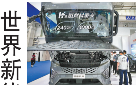
◆8月27日，2022世界新能汽車大會在北京開幕。圖為參觀者觀看展出的一款氫燃料重卡產品。

此次大會的空間科學國際高峰論壇，由中國空間科學學會、中國科學院國家空間科學中心和國際空間科學委員會（COSPAR）聯合主辦。論壇採取線上、線下相結合的方式，邀請歐洲空間局、國際空間研究委員會、美國、俄羅斯、法國、德國、西班牙、意大利、巴西等國的頂級科學家和管理專家進行深入交流，增進國際航天界的相互信任與合作。