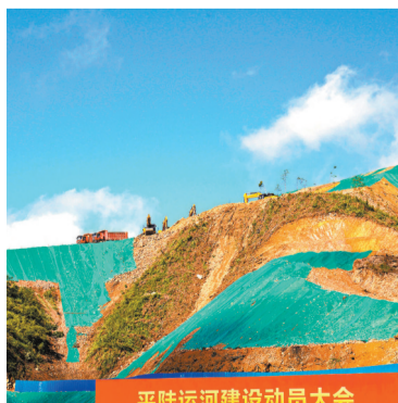
◆8月28日，平陸運河建設動員大會廣西壯族自治區欽州市靈山縣舊州鎮馬道樞紐現場召開。圖為工程機械在現場施工。

平陸運河集團有限公司表示，將力爭12月前完成全線工程初步設計和技術圖紙的審批工作，為2026年底工程全面建成打下堅實基礎。