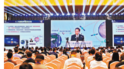
◆中國空間科學大會設置了1場空間科學國際高峰論壇、13場大會特邀報告。

大會為期四天，設置了1場空間科學國際高峰論壇，13場大會特邀報告，32場分會學術交流，參會人員將充分圍繞空間天文、空間物理、月球與行星科學、空間地球科學、微重力