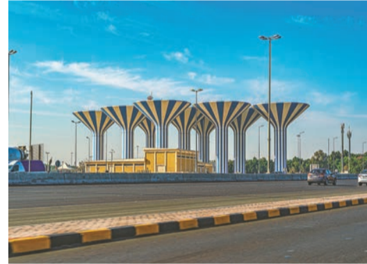
科威特獨有的高大水塔群。