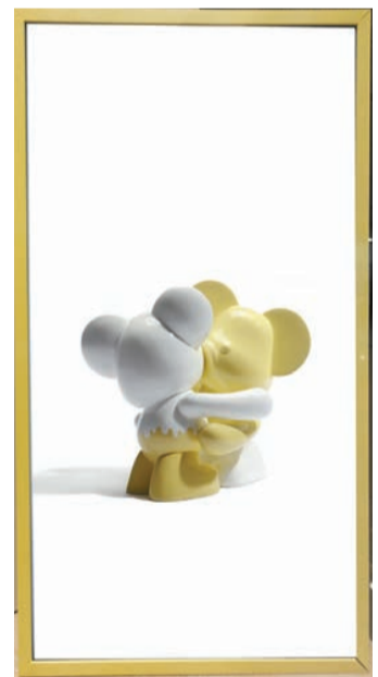
Jibin Im 作品「Frame Your Love」系列，裝裱以不反光的OLED呈現藝術細節。

日期：即日起至9月1日 時間：上午10時半至晚上9時半 地點：中環金融街8號國際金融中心商場P2 2033號舖SHOUT Gallery 內容：科技藝術是近年一個新的藝術類別，最近韓國藝術家Jibin Im聯乘本地畫廊及三星，呈獻一系列香港限定的作品，包括以自訂畫框電視為設計靈感，創作出酷似真實掛畫的「Frame Your Love」系列。這是藝術家首個以數碼科技及實體形式創作的藝術系列，製作同色系抱抱熊藝術裝置的同時，將實體抱抱熊公仔帶到數碼世界，以霧面技術屏幕為「畫布」，將科技藝術生活化。此外，藝術家以小熊氣球藝術裝置快閃世界各地而聞名，是次他將標誌性黑白小熊氣球重新設計，在小熊氣球臉上印上「CHILL」字樣，藉此表達香港人在這個節奏急促的繁華都市，亦不忘適時放鬆的生活方式。 文：儀