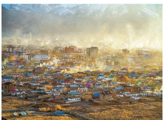
《帶路II》的封面圖巴彥烏勒蓋省，該省始建於1940年，位於蒙古西部邊境。