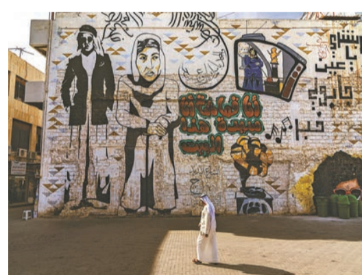
科威特的傳統市集一瞥。