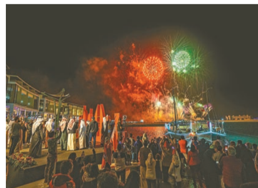
巴林國慶日的煙花。