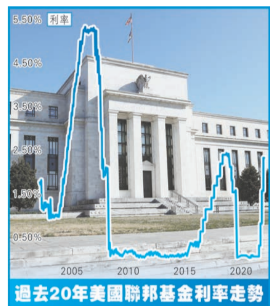
過去20年美國聯邦基金利率走勢