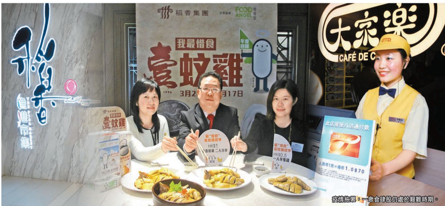
疫情拖累，一眾食肆股仍處於艱難時期。

香港素有「美食天堂」的美譽，但新冠肺炎疫情持續近三年，本港飲食行業經營極為艱難，不少食肆品牌已支撐不住一一告別舞台，從許留山到珍寶海鮮舫，再到香港零食大王優之良品結業。本地零食及飲食股前路茫茫，從使出各出奇謀仍難敵宏觀大勢，業內人士最期盼就是早日恢復與內地通關，才有望扭轉今天的困局。