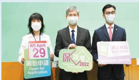
這兩年港府推出的保就業津貼支持眾多食肆繼續經營。

敘福樓集團(1978)，2020年獲港府防疫抗疫基金發出的一次性持牌食物業類別的資助約4380萬元，而去年則只有962萬元。至於稻香2021年獲港府補助3237萬元，相對2020年有關補貼達1.66億元。