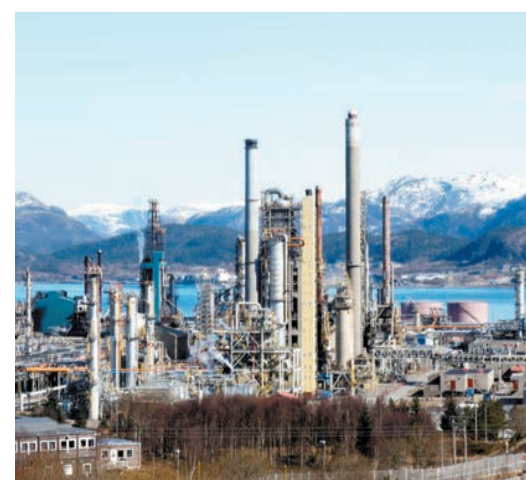
全球經濟疲弱需求下跌，可能令油價回落。