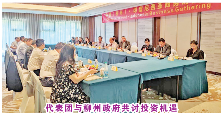
代表团与柳州政府共谈投资机遇