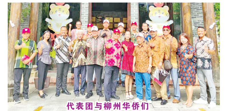
代表团与柳州华侨们