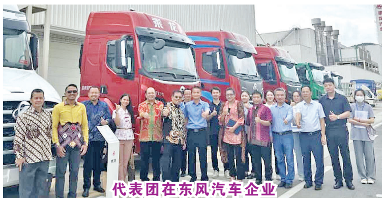
代表团在东风汽车企业