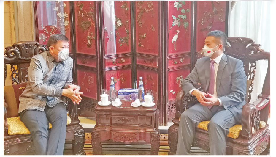
8月25日，陆慷大使会见新加坡驻印尼大使 Kwok Fook-Seng。双方高度评价两国友好合作关系，愿继续加强沟通与交流。