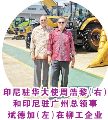
印尼驻华大使周浩黎(右)和印尼驻广州总领事斌德加(左)在柳工企业

已进入印尼市场，但随后停止销售了。我们也希望不久通过电动商用车重新打进印尼市场”，东风柳州汽车副总刘小平说道。 为吸引潜在投资商，此次访问还在2022年8月23日举行了《商务聚会：印尼政策更新和投资机会》线上交流会，来自14家公司约30名潜在投资商参与了此次讨论。印尼驻华使馆投资专员Evita Sanda就印尼政策和投资机会进行了讲解。 印尼代表团还与柳州市华侨、归侨、印尼留学生等进行会面，并用流利印尼语及爪哇语和华侨交流甚感亲密。有趣的是，在柳州有3个印尼村的侨民经常用爪哇语进行沟通。 供稿：印尼驻广州领事馆