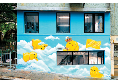
◆一幅8呎高壁畫是打卡好去處。

近年，不少品牌為大家提供創新購物體驗，當中包羅了藝術元素，讓大家置身其中，即可感受一下創新藝術感覺，同時亦可品嘗特色咖啡，實行跨越界限的零售創藝空間，讓大家在購物的時候，也可以放鬆心情。