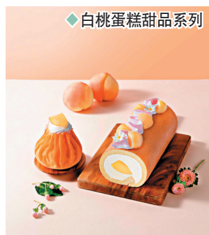
◆白桃蛋糕甜品系列

日本的蛋糕甜品一向都深受人歡迎，蛋糕及甜品品牌 Mon cher 最近就推出白桃蛋糕甜品系列，當中堂島卷內扎實地裹着粒粒白桃果肉，內層是特製濃郁的香滑白桃忌廉夾心，卷上亦以厚切白桃果肉、原味忌廉椰花及小花朱古力配件相間作裝飾，充滿陽光生氣。另外，新店限定甜品日本山形縣白桃 Happy Pouch，以精緻可人的蜜桃粉紅造型人；粉紅千層皮內裹着原味蛋糕、香甜白桃醬、濃滑原味忌廉及多汁白桃，頂部再以白桃果肉點綴，演繹甘甜多汁的白桃滋味。