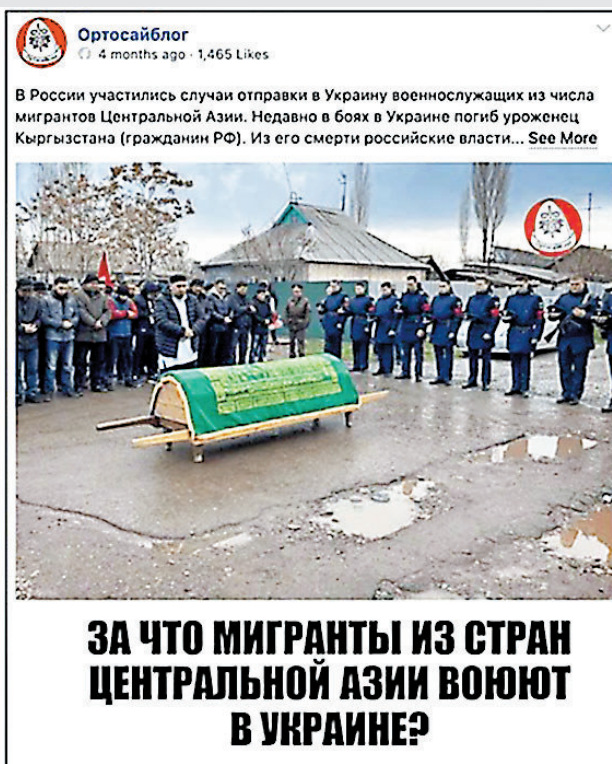
◆假賬號抹黑俄羅斯派少數族裔(左圖)及中亞移民(右圖)參與俄烏衝突。網上圖片