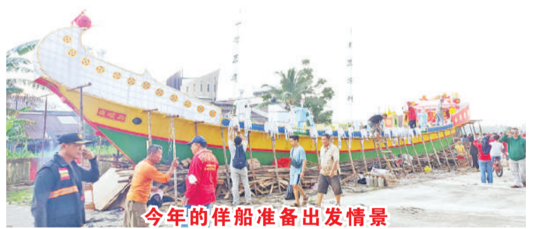
今年的伴船准备出发情景

2022年8月12日(星期五)早上,西加孔教华社总会理事们在罗俊丰总主席与孟兰盛会筹委会主席杨汉城的陪同下假座该会议冢前的大广场主持秋祭,结束今年的秋祭活动,中午两点开始在广场上举行孟兰胜会的抢孤与烧伴船活动,这也是疫情后循例的首次公开活动,前来参加的民众比往年少的多,经过一系列祭拜仪式后,抢孤开始,接着就要烧伴船的时候,突然乌云密布并下大雨,但全体理事们不受大雨倾盆的影响,顺利吧伴船烧的一干二净,圆满结束后才返道回家。史帝芬报道