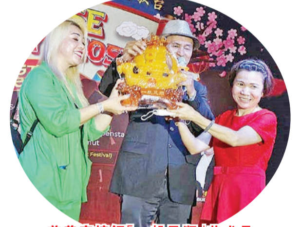
慈善家接领「一帆风顺」艺术品