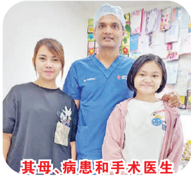
其母、病患和手术医生