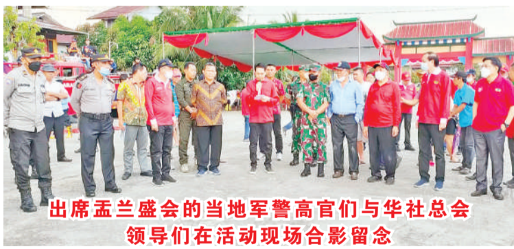
出席孟兰盛会的当地军警高官们与华社总领导们在活动现场合影留念

2022年8月12日(星期五)早上,西加孔教华社总会理事们在罗俊丰总主席与孟兰盛会筹委会主席杨汉城的陪同下假座该会议冢前的大广场主持秋祭,结束今年的秋祭活动,中午两点开始在广场上举行孟兰胜会的抢孤与烧伴船活动,这也是疫情后循例的首次公开活动,前来参加的民众比往年少的多,经过一系列祭拜仪式后,抢孤开始,接着就要烧伴船的时候,突然乌云密布并下大雨,但全体理事们不受大雨倾盆的影响,顺利吧伴船烧的一干二净,圆满结束后才返道回家。史帝芬报道