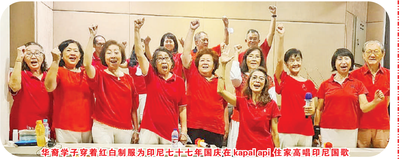
华裔学子穿着红白制服为印尼七十七年国庆,在 kapal api 住家高唱印尼国歌

去了国家观念,受到崇拜媚外的灌输很深,尤其是一些华侨子弟们,想起来非常的痛心。今年在英明的佐科总统领导下,举行了比以往更特别的隆重仪式,使我们这些曾受过华文教育的学子都感慨万千,在各自领域里也不甘示弱地举行简单且有意义的国庆仪式。当唱起了好几年不曾唱过的国歌,个个都热泪盈眶,激情地握起拳头高举“merdeka!merdeka!” 吴夏兰