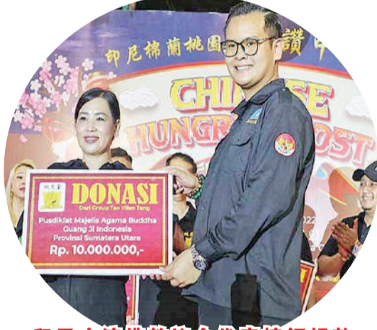
印尼广济佛教议会代表接领捐款

Sungai Air Hidup, Pusdiklat-Majelis Agama Buddha Guangli (广济)Indonesia, Lion Club Medan chakra Cancer anak& Mata Katarak。最后在头瑞狮狂舞后,焚化 Pho Tho Gong 而圆满结束。陈平治报道