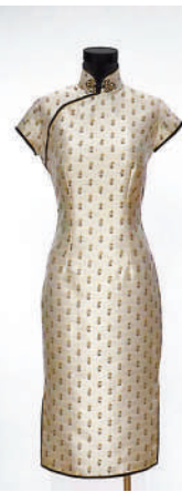
◆旗袍已成為服裝的經典。

服裝代表一個民族的文化特色。中華民族偉大復興，首在中華傳統文化的復興；中華傳統文化要復興，就不能不重視我們傳統的服裝。所以旗袍的意義不只在於美，還關係到民族的文化自信。