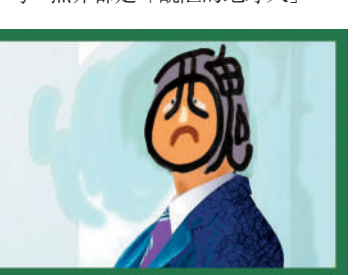
◆說他來自ABCD國都可以。

其實人性各有善惡好醜不同面目，真真執着他醜陋的一面，本來大都相似，什麼醜陋的A國人B國人，只不過那些A那些B各自佔有其中某一不同部分的醜陋，任從A國B國的作者，從不同偏激角度抽不同的絲刺不同的爾盡情誇大，綜合一句，無非都是「醜陋的地球人」。